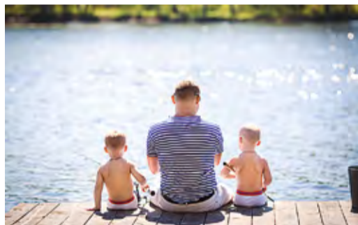
Как природа хороша, когда сидишь на рыбалке, никуда не спеша

В сегодняшнем номере корпоративного издания мы размещаем фотографии новых участников и претендентов на главный приз!