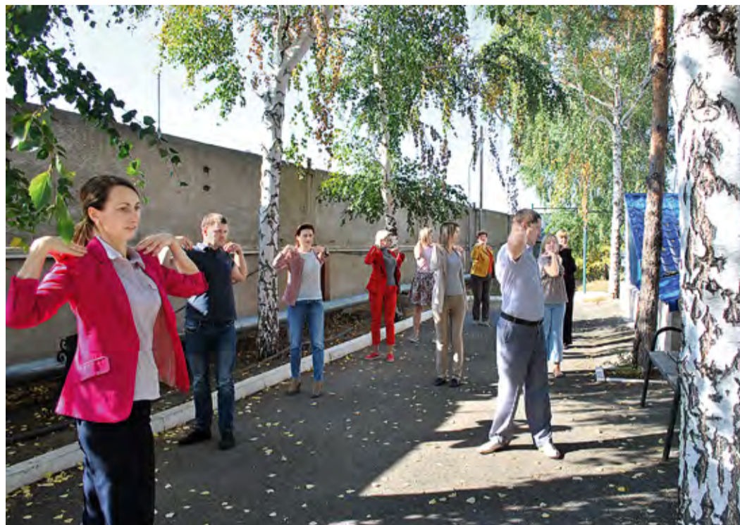
Во время и после зарядки активность сотрудников возрастает

«Упражнения нельзя недооценивать, потому что работа зачастую бывает сидячая, долгая, данные упражнения помогают нам всегда быть в тонусе, поддерживать хорошее настроение и просто оставать-