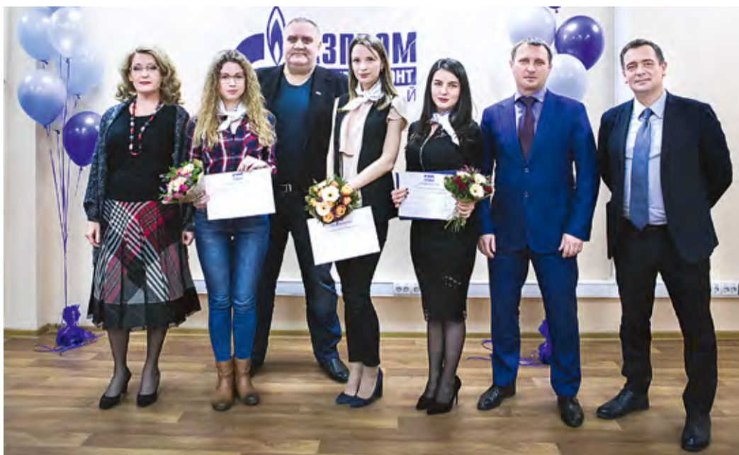
Волнующие мгновения посвящения в молодые специалисты

– У нас зарождается настоящая хорошая традиция – посвящение в молодые специалисты, – обратился к собравшимся