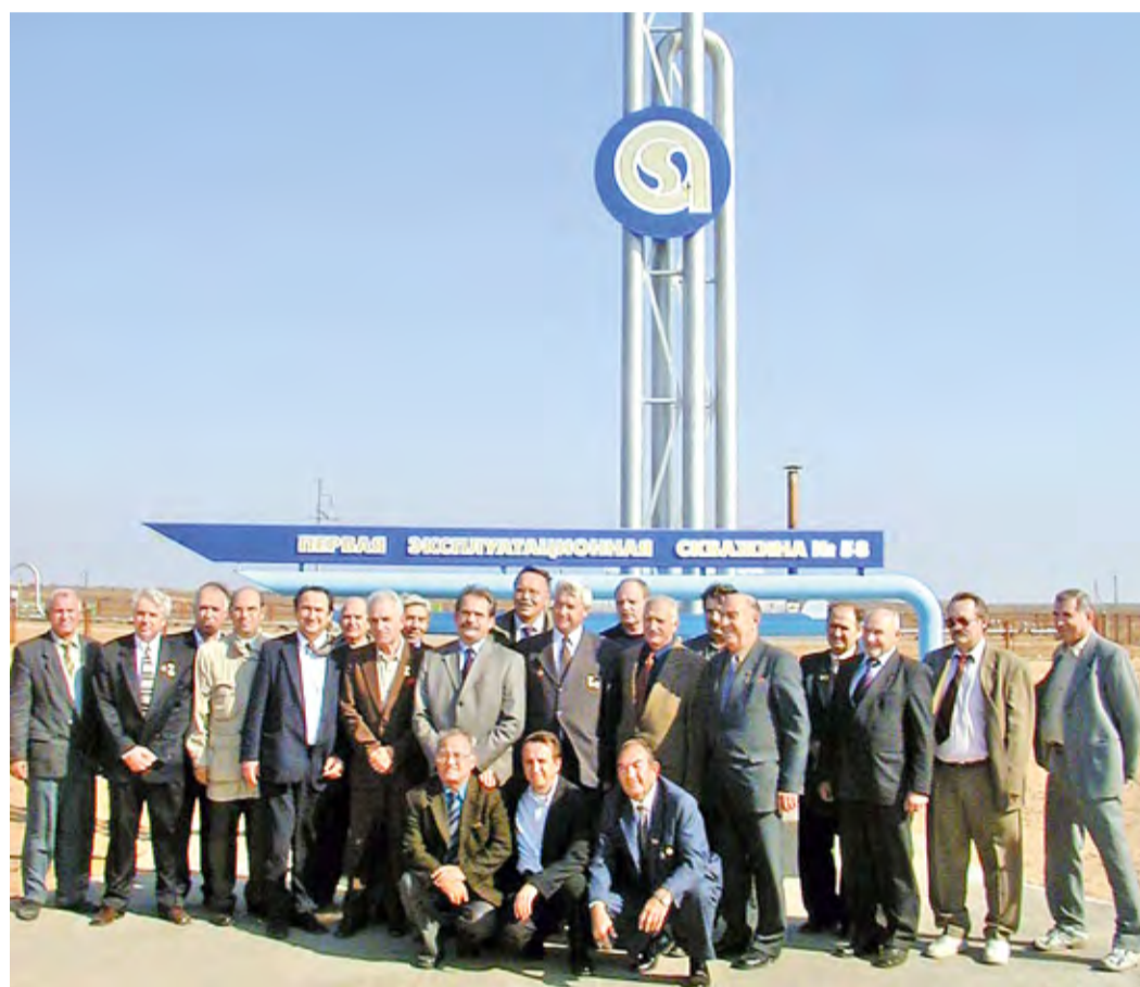
Ветераны предприятия на скважине №58 Астраханского ГКМ

Пятьдесят восьмой уделяли особое внимание, часто приезжали представители министерства из Москвы, зарубежные специалисты контролировали процесс опрессовки и спуска подземного оборудования, подсказывали, как делать правильно. После вскры-