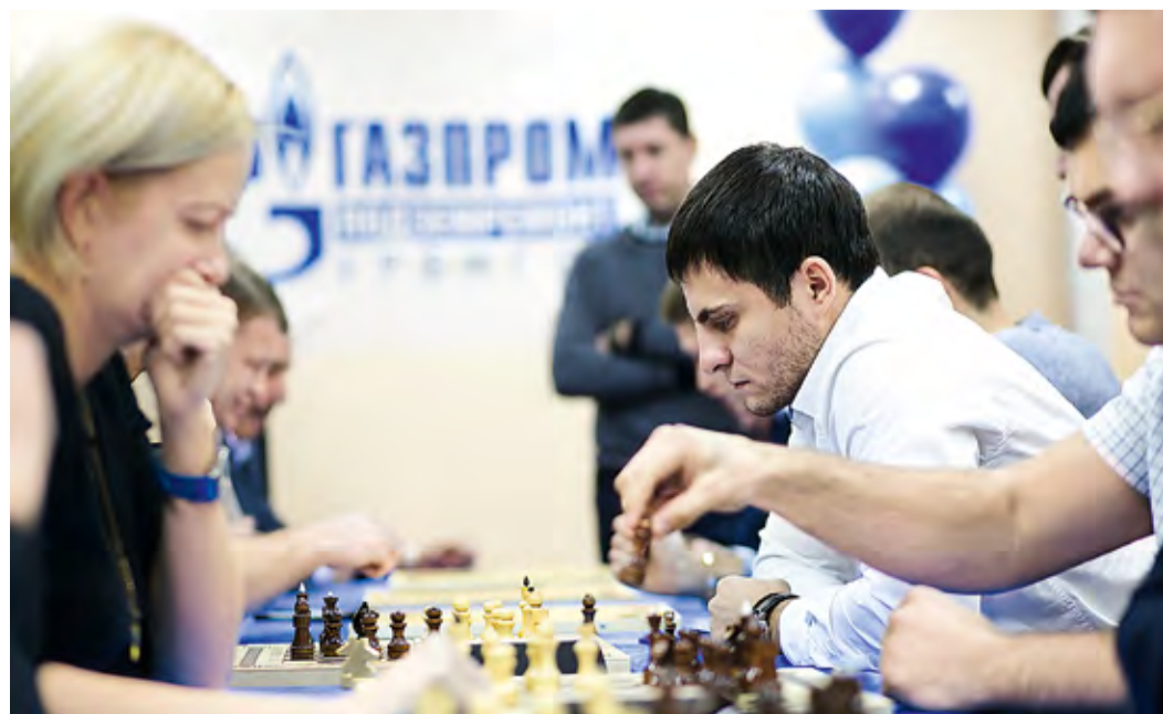
Соревнования, состоявшиеся после официальной части, протекали при большом стечении болельщиков