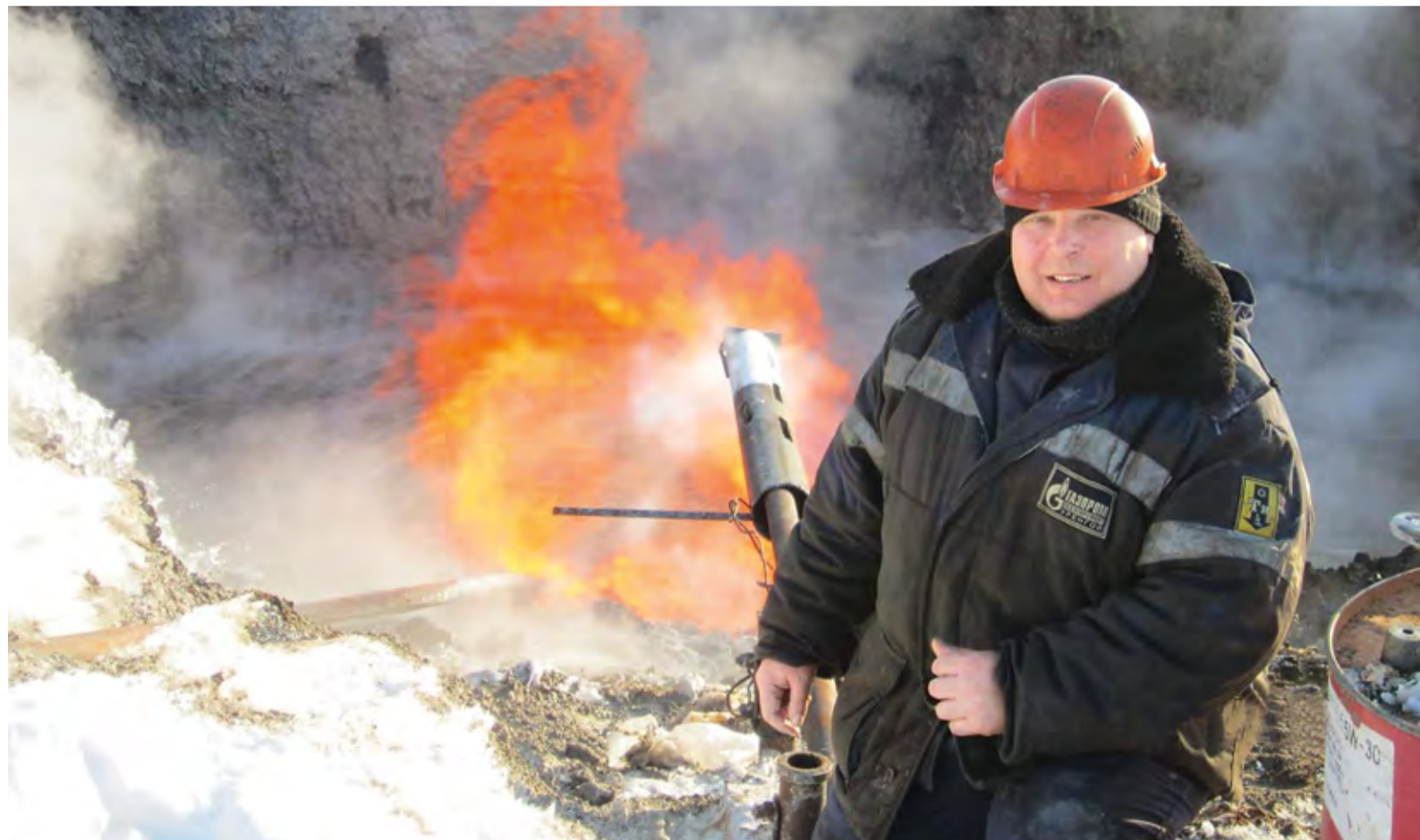
Во время испытания скважины