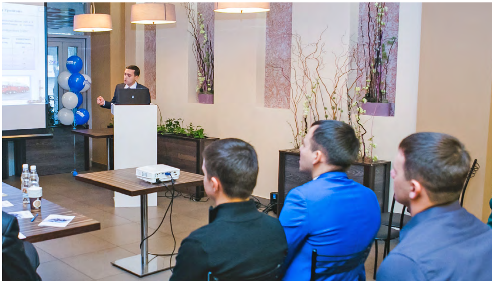
Выступления участников оказались не только глубокими и разнообразными, но и эмоционально насыщенными

Несомненно, что новаторские идеи найдут свое отражение в деятельности предприятия. Внедрение новых разработок помогает компании стать сильнее, оптимизировать свои расходы, дает конкурентные преимущества. И что самое важное – наша конференция постепенно становится настоящей фабрикой инноваций, пока только в молодежном, исследовательском формате, но это, как известно, первый шаг на пути к серьезным технологическим прорывам.