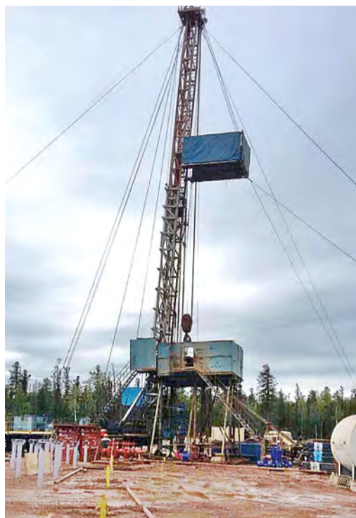
Установка МБУ-125 во время операции по расконсервации скважины на Ковыктинском месторождении

В настоящее время компания продолжает опытно-промышленную разработку Ковыктинского месторождения – крупнейшего в Восточной Сибири по запасам газа. Для их уточнения и подготовки к промышленному освоению «Газпром» проводит комплекс масштабных геологоразведочных работ. В частности, в 2016 году выполнены сейсморазведочные работы 3D в объеме 2,1 тыс. кв. км и завершено строительство трех разведочных скважин. До 2020 года планируется организовать трехмерную сейсморазведку на площади 5,2 тыс. кв. км, пробурить еще 14 разведочных скважин.