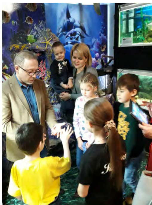
Участники конкурса на Детской экологической станции

Для всех участников конкурса филиалом Уренгойское УИРС была организована экскурсия на Детскую экологическую станцию. Это была отличная возможность увидеть вживую удивительных представи-