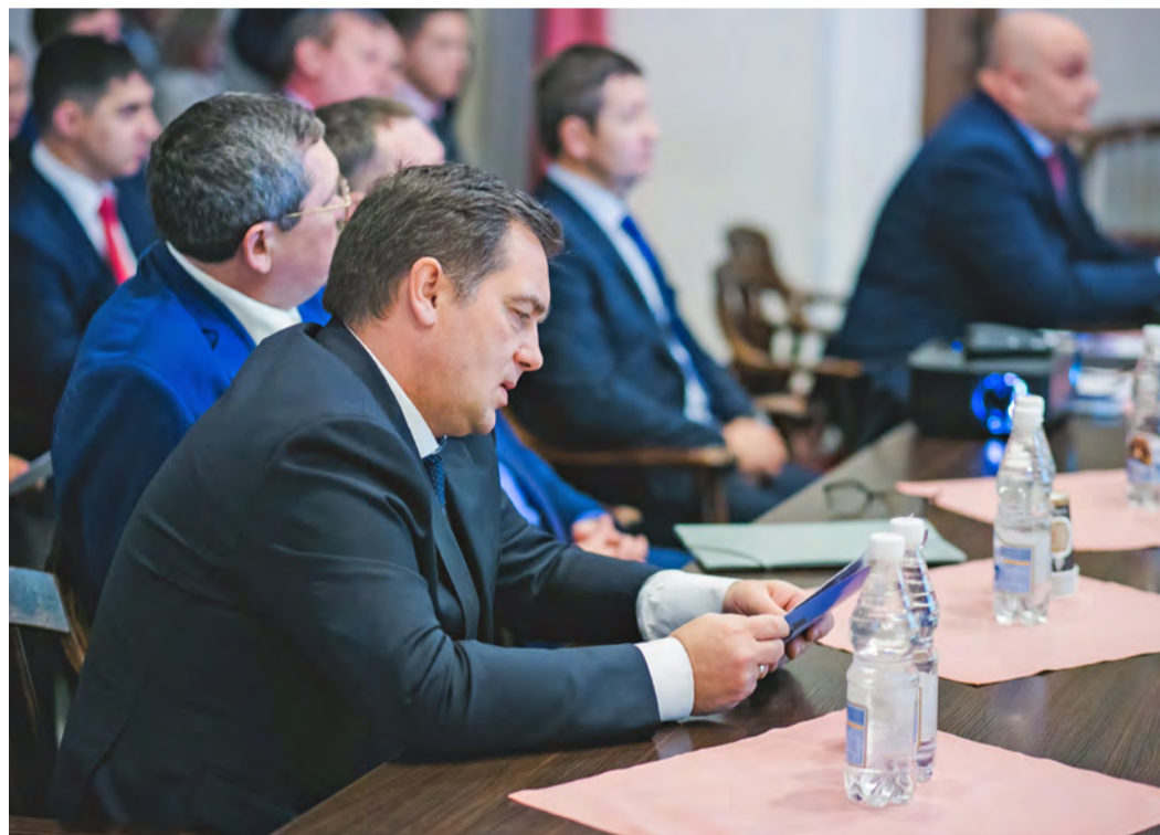
Вопросы, рассматриваемые на конференции, заинтересовали не только молодых специалистов, но и топ-менеджеров компании