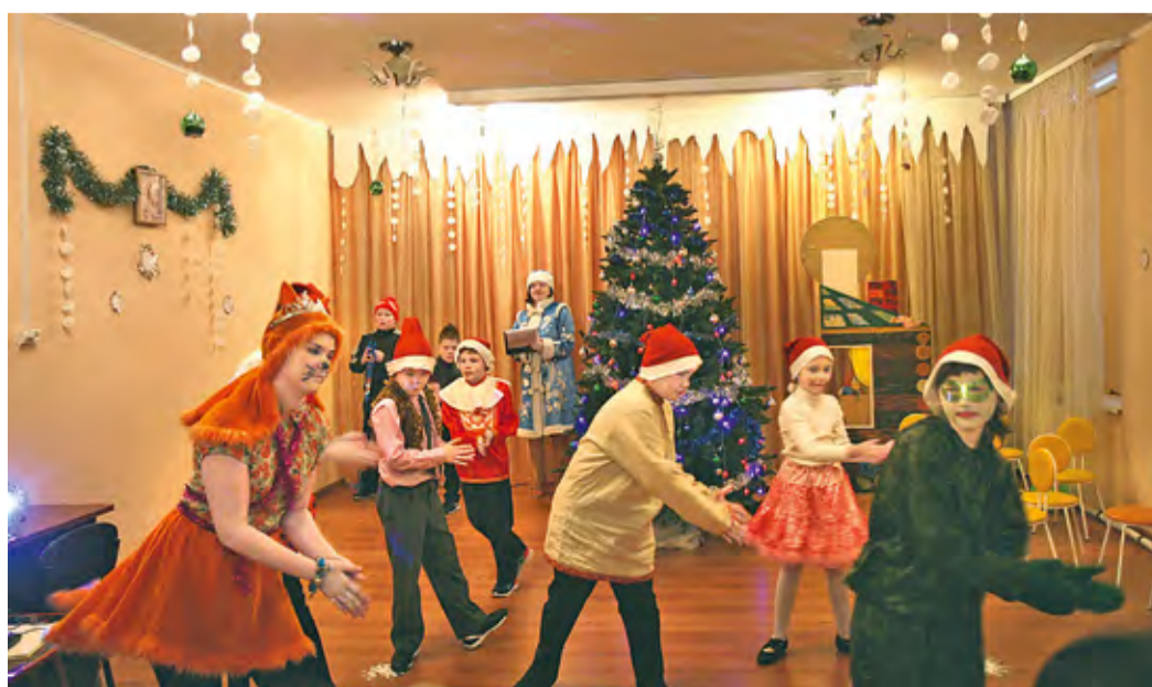
Сказка «Теремок» в новогодней интерпретации

ционному центру для несовершеннолетних современный многофункциональный пылесос, канцелярские принадлежности, теплые вещи и много-много других полезных вещей. К сбору предметов для творчества подключились и остальные сотрудники Общества.