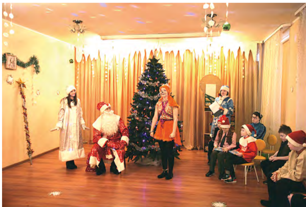
Праздник в приюте для несовершеннолетних города Всеволожска