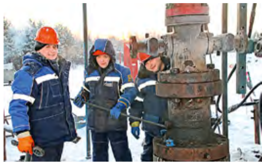
НОВАЯ УИРС НА ПЕРЕДОВОЙ Специалисты филиала ведут работы на месторождениях Ямала, Якутии и Камчатки СТР. 2