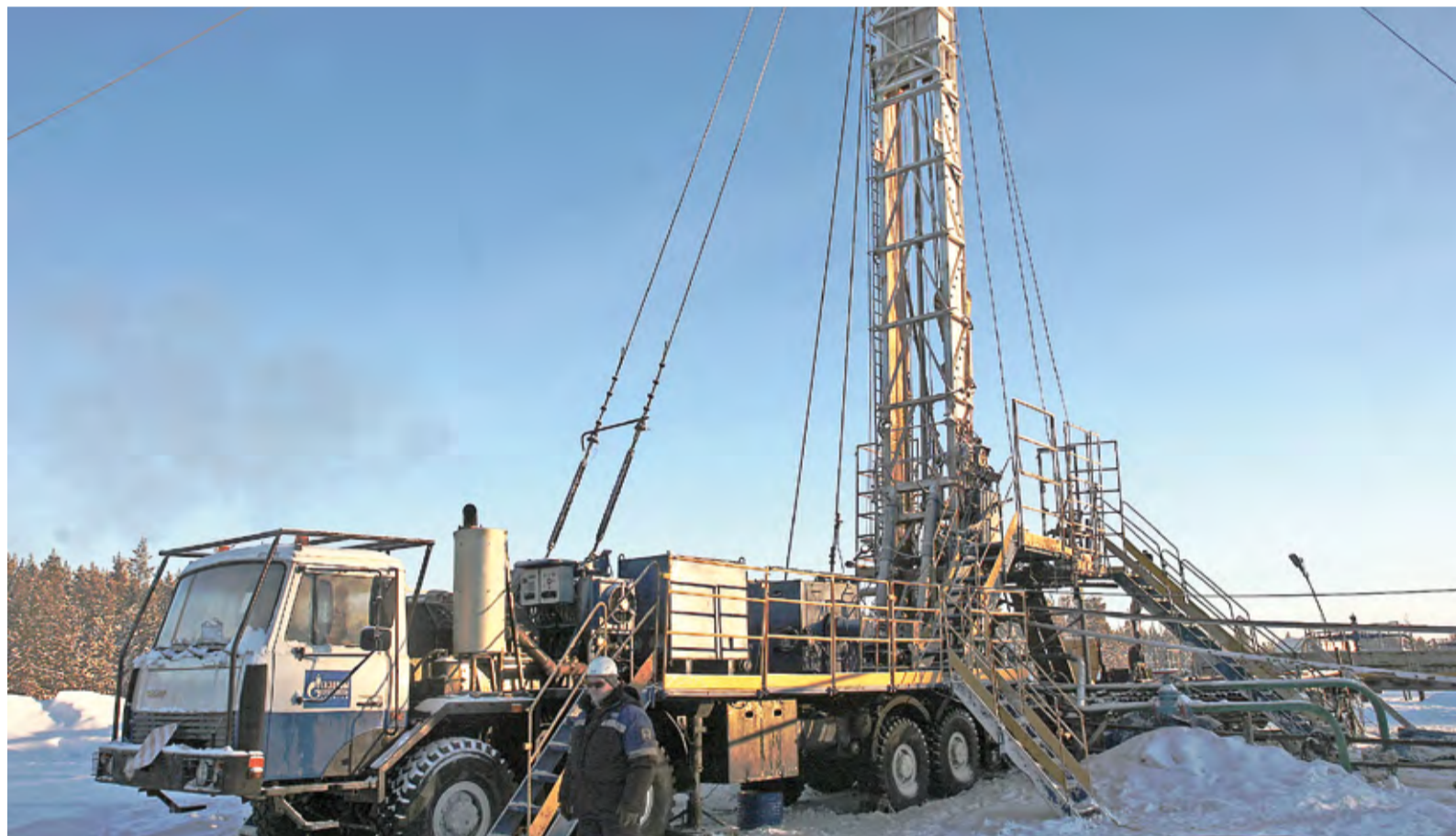
ООО «Газпром подземремонт Уренгой» завершило 2017 год с положительными результатами производственно-хозяйственной деятельности

В начале года завершился процесс интеграции Оренбургского, Астраханского, Краснодарского и Вуктыльского филиалов в структуру ООО «Газпром подземремонт Уренгой». Теперь география работы компании существенно расширилась. От Камчатки до Краснодарского края, от Оренбурга и Астрахани до шельфа Ледовитого океана – спектр деятельности ООО «Газпром подземремонт Уренгой».