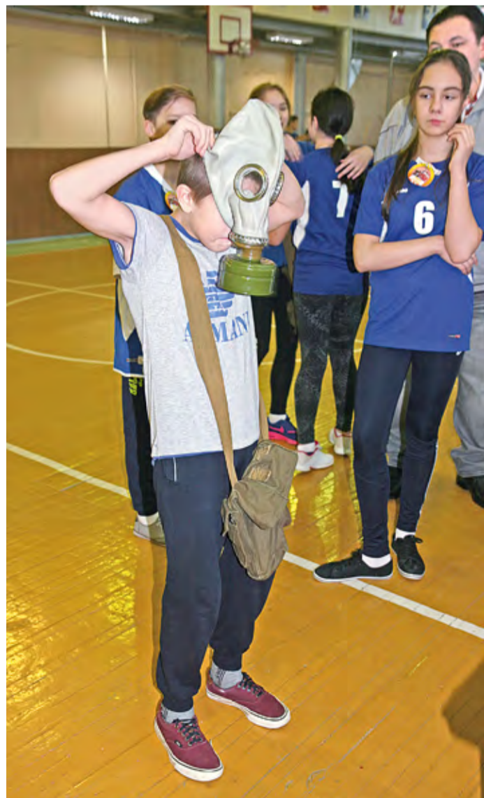
Юные пожарные во время соревнований

В спортивном зале 7-й пожарно-спасательной части состоялись ежегодные соревнования среди дружин юных пожарных нашего города «Поезд безопасности – 2017».