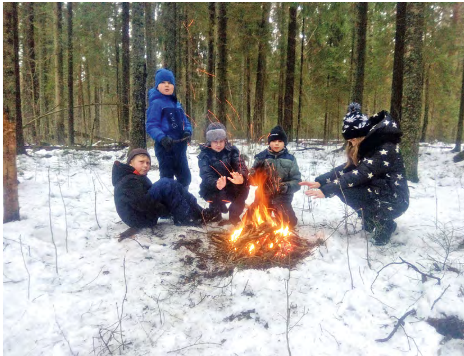
«Витязи» на привале во время многодневного похода

Малыши и подростки из самых разных семей (большинство, к слову сказать, из семей многодетных) растут людьми Слова и Дела.