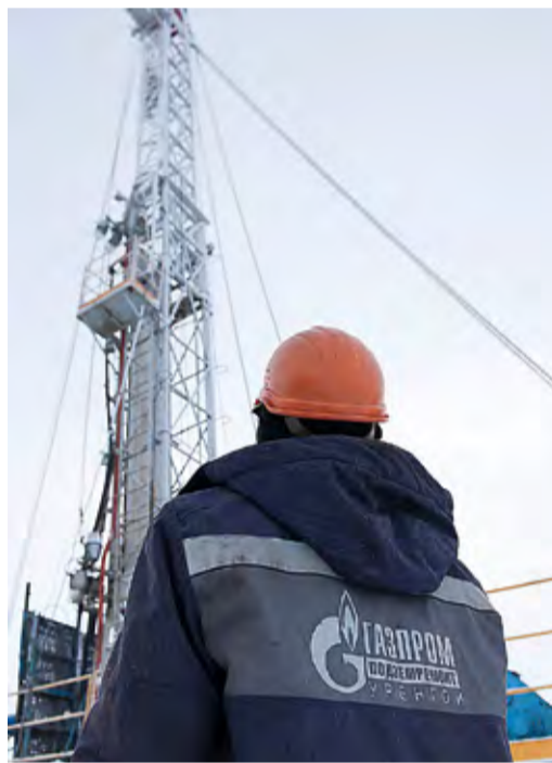
Будни бригады капитального ремонта скважин №7 Ноябрьского УИРС на Чайандинском месторождении

мальной интенсивностью набора кривизны до 90 градусов и глубиной забоя 2500 метров. Как говорит Егоров, «скважина скважине рознь». Суровый климат (в Якутии, как известно, находится полюс холода) требует дополнительных мероприятий. Чрезвычайно строги также экологические требования. Например, входной контроль бурового раствора, поставляемого заказчиком, осуществляют как представители Ноябрьского УИРС, так и «Газпром добычи Ноябрьск» и «Газпром бурения». Все существующие нормы соблюдаются безусловно.