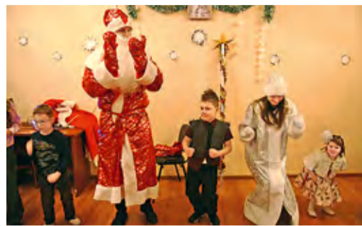
ТЕПЛАЯ РУКА ПОМОЩИ Сотрудники компании собрали новогодние подарки детям из приюта СТР. 4