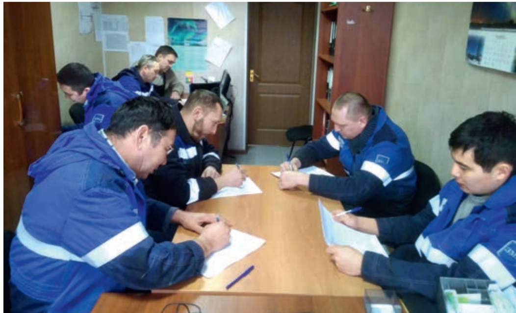
Борьба между конкурсантами шла за каждый балл