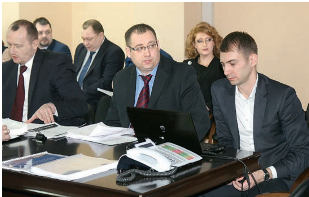
Итоги работы подразделений компании впервые обсудили в Санкт-Петербурге

Особое внимание было уделено теме охраны труда, соблюдению техники безопасности, обеспечению работников средствами индивидуальной защиты, а также созданию благоприятных бытовых условий на месте проведения работ и проведению мероприятий по улучшению условий труда и охране труда.