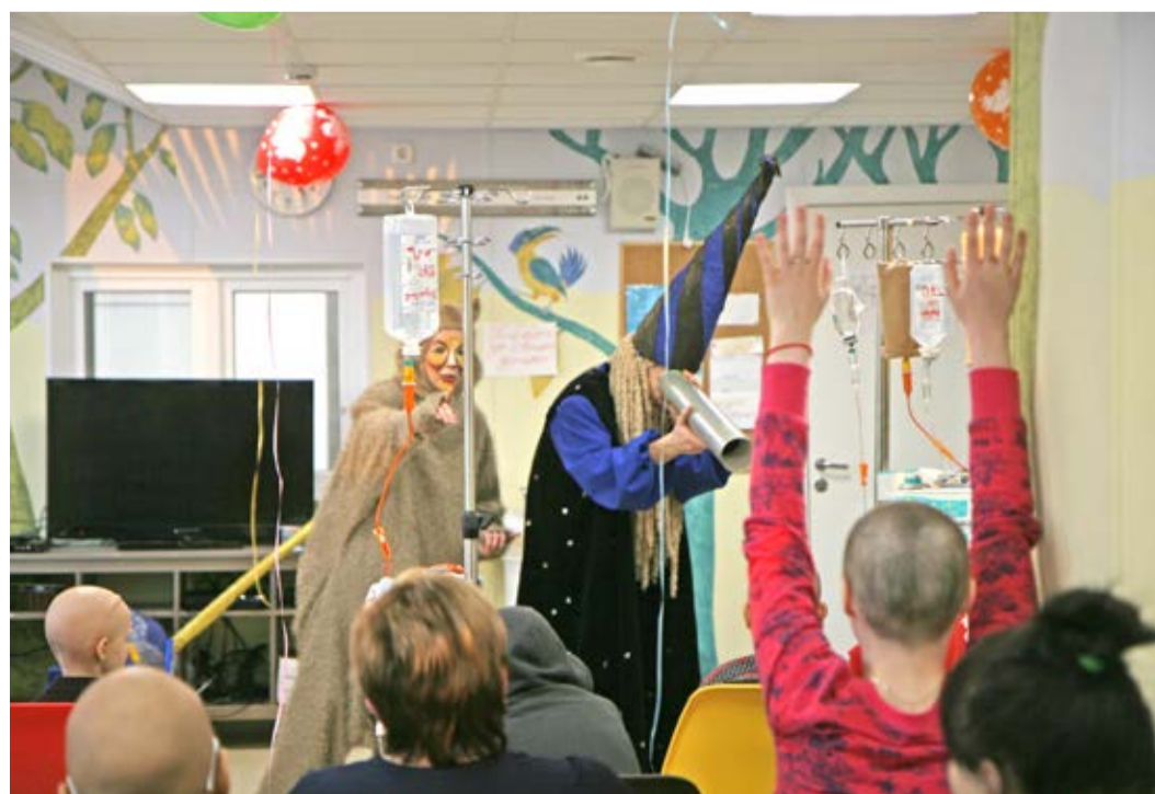
Артисты театра «СоЛу» постарались сделать представление для юных пациентов веселым и увлекательным

Итог турнира оказался закономерен, места в таблице результатов распределились следующим образом: на первом месте – команда Цеха специальной технологической техники, на второй позиции – сборная Аппарата управления, «бронза» досталась команде БПО, четвертой на этот раз стала футбольная дружина Цеха капитального ремонта и ликвидации скважин. ■