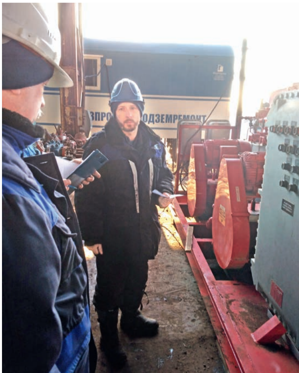
Участники профессионального конкурса во время очередного этапа на базе производственного обслуживания Астраханского филиала