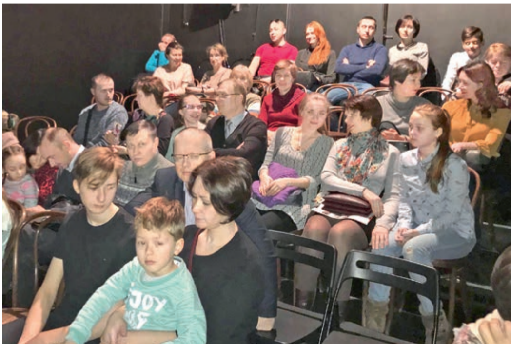
Во время спектакля зрители смогли насладиться игрой актера и ощутить атмосферу пушкинской эпохи