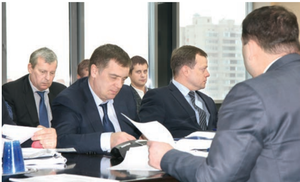
Участие в работе совещаний приняли руководители и специалисты филиалов предприятия

Обсуждались темы внедрения рационализаторских предложений, повышения экономического эффекта от их применения. Шел разговор об обновлении технологического парка, уменьшении затрат – как финансовых, так и ресурсных (химреагентов, дизтоплива, расходных материалов).