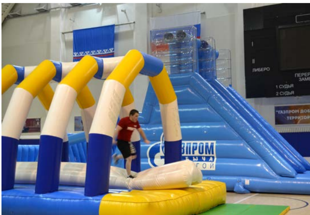
Эстафета оказалась сложной и местами непредсказуемой

Пришло время испытать равновесие и сноровку атлетов на надувном бревне и про-