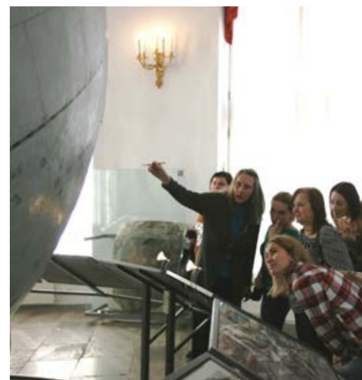
В Музее антропологии и этнографии им. Петра Великого (Кунсткамере) наших сотрудников особенно заинтересовал огромный Готторпский глобус

– Нам повезло, экскурсия оказалась очень интересной, много нового узнали и взрослые и дети. Получился замечательный и яркий праздник для всех без исключения. Пожелание одно – проводить больше таких интересных и увлекательных экскурсий. Спасибо большое организаторам!