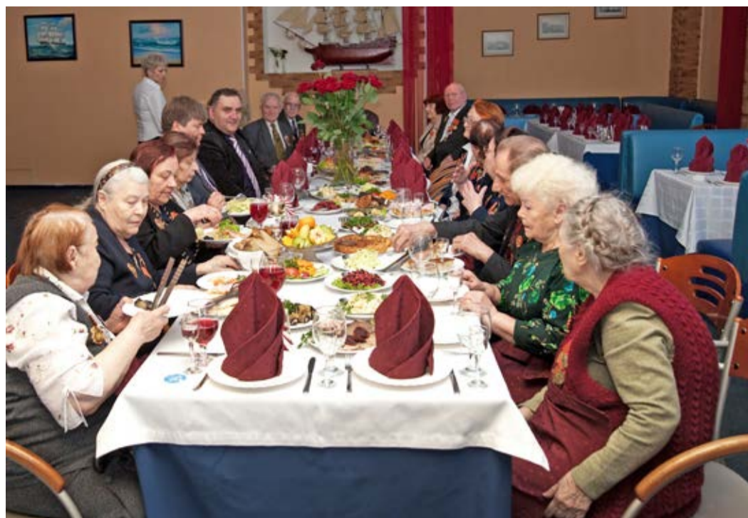
Сотрудники профсоюзной организации на встрече с ветеранами Великой Отечественной войны