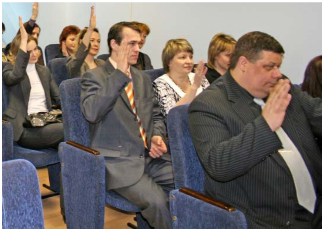
Первое организационное собрание первичной профсоюзной организации аппарата управления предприятия