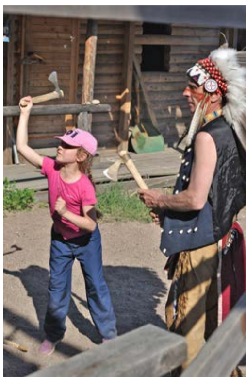
В День защиты детей на ранчо в окрестностях Петербурга

Поездка на ранчо «Белый шиповник» оставила очень хорошие впечатления.