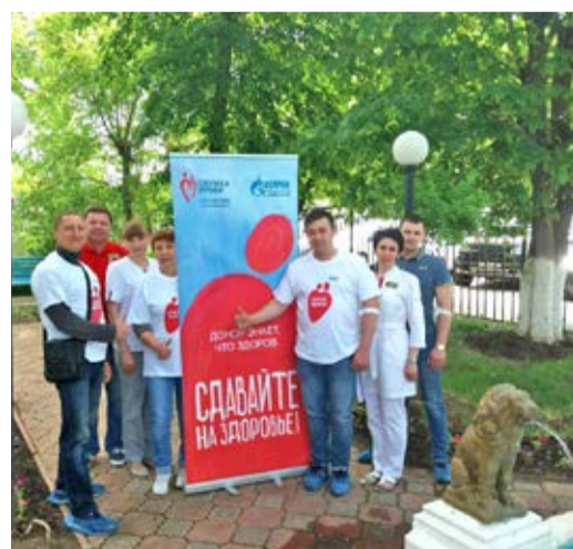
Работники Общества во время сдачи крови в г.Оренбурге

Накануне Всемирного дня донора, который отмечается 14 июня, сотрудники компании «Газпром подземремонт Уренгой» вновь отправились на Станцию переливания крови. 15 человек подключились к добровольческому проекту «Корпоративное донорство – равнодушных нет!» ООО «Газпром центрремонт». Неделей раньше донорская акция прошла и в Оренбургском УИРС.