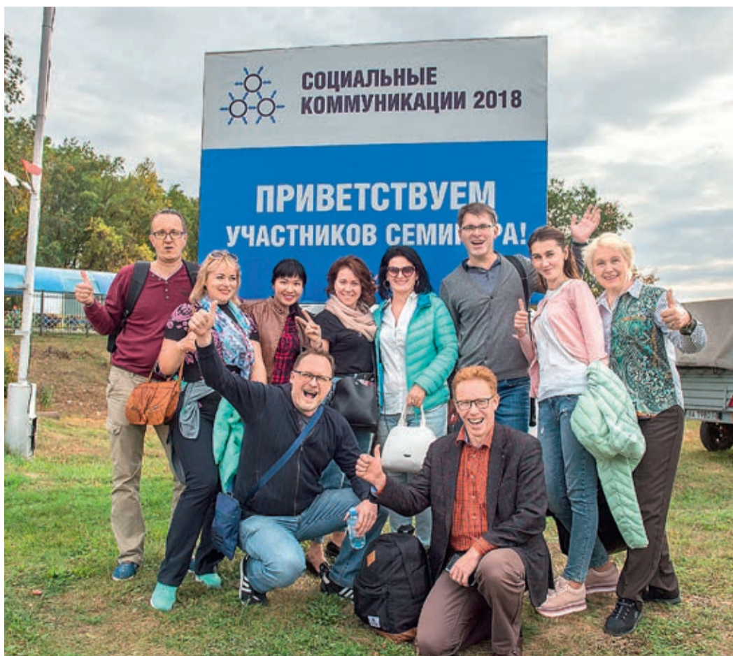
Участники семинара с восторгом отзывались и о месте проведения мероприятия, и о содержании учебного процесса

Руководители служб по связям с общественностью дочерних обществ ПАО «Газпром» совершили экскурсию на производственную площадку ООО «Газпром нефтехим Салават», посетив действующие установки и строящиеся производства.