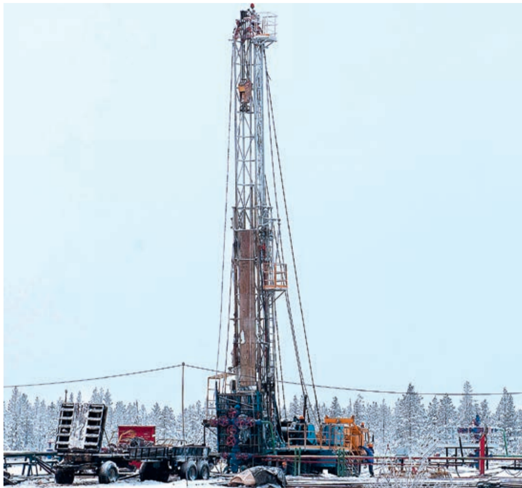
Объемы работ на ямальских месторождениях также остаются значительными

Кроме этого, в ЦКРС №2 (Чаяндинское НГКМ) значительно увеличился штат работников и специалистов, расширился парк спецтехники. Летом 2018 года филиал Ноябрьское УИРС получил на баланс предприятия жизненно необходимый парк техники для успешного выполнения производственной программы на Чаяндинском НГКМ: шесть цементировочных агрегатов, две передвижные паровые установки автомобильные 1600/100, одну водовозку АЦП-10, два подъемных агрегата в полном комплекте, четыре дизельные электростанции ДЭС-100, вагончики разного назначения в количестве 20 штук, емкости в количестве 14 штук, а также буровое оборудование. Такое обновление парка позволяет с оптимизмом войти в осенне-зимний период 2018–2019 года для обеспечения