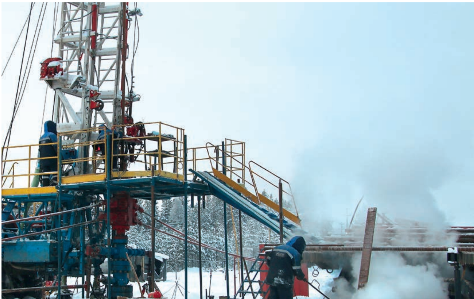
На Чаяндинском НГКМ в 2018 году значительно увеличился штат работников и парк спецтехники