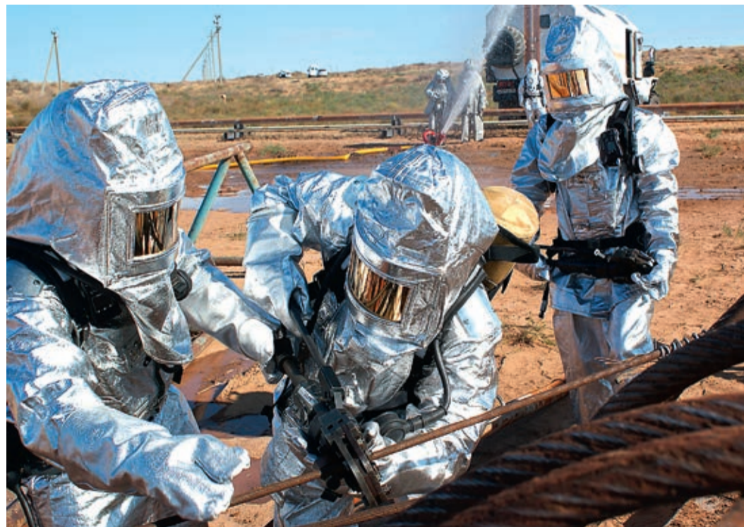
Процесс локализации аварии условно сопровождался интенсивным выбросом промывочной жидкости и загазованностью территории

Основная цель учений – совершенствование практических навыков руководителей в управлении силами подсистемы гражданской защиты дочерних обществ ПАО «Газпром».