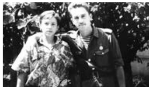
ДЕНЬ ЗАЩИТНИКА ОТЕЧЕСТВА О долге русского солдата рассказывают сотрудники филиалов