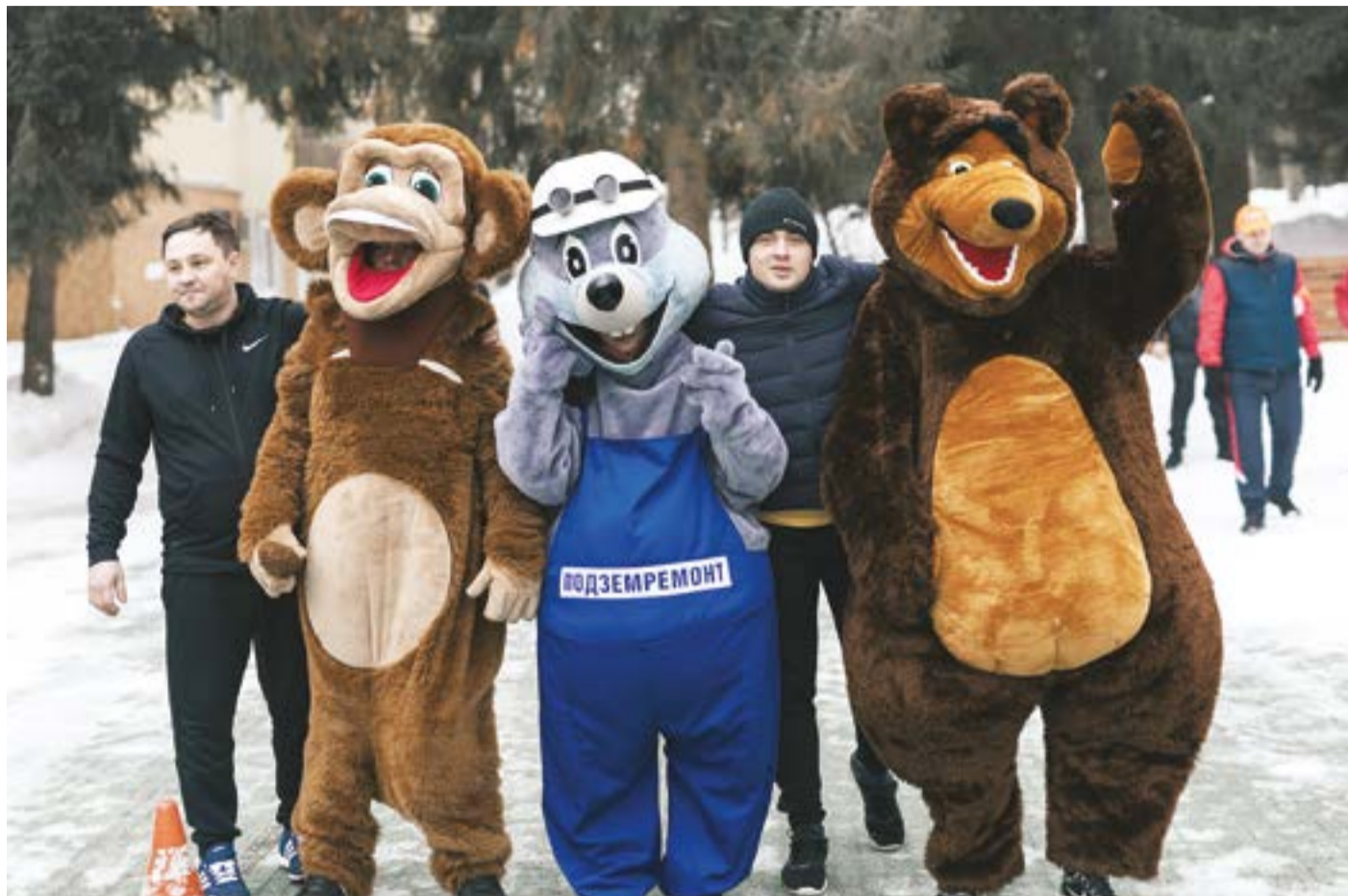
Веселая команда талисманов Спартакиады вышла на старт

Последним и самым массовым событием научно-спортивного триатлона стала VII Спартакиада общества. Команды соревновались в семи дисциплинах: плавание, боулинг, нарды, дартс, стрельба, настольный теннис и эстафета.