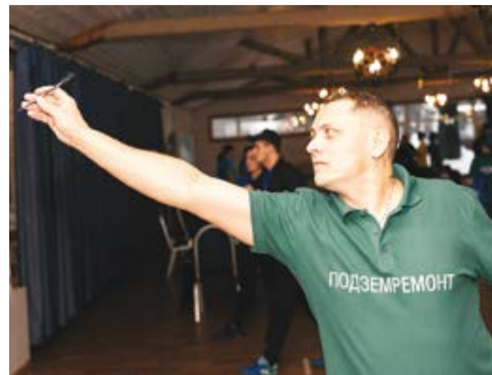
В дартсе играл только сектор 20