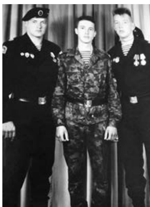
С боевыми друзьями

Короткие строки отчетов: с января по июнь 1995 года воинские части 336-й бригады были привлечены к участию в Первой чеченской войне. В составе отдельных штурмовых батальонов морские пехотинцы участвовали в боях за президентский дворец. Так же они были задействованы в боевых