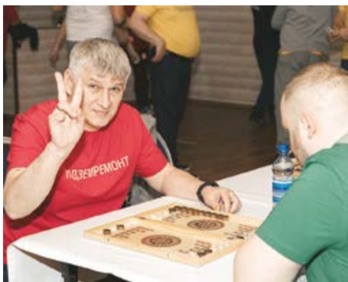
Продуманным ходам игроков в нарды позавидовали бы и профессионалы!