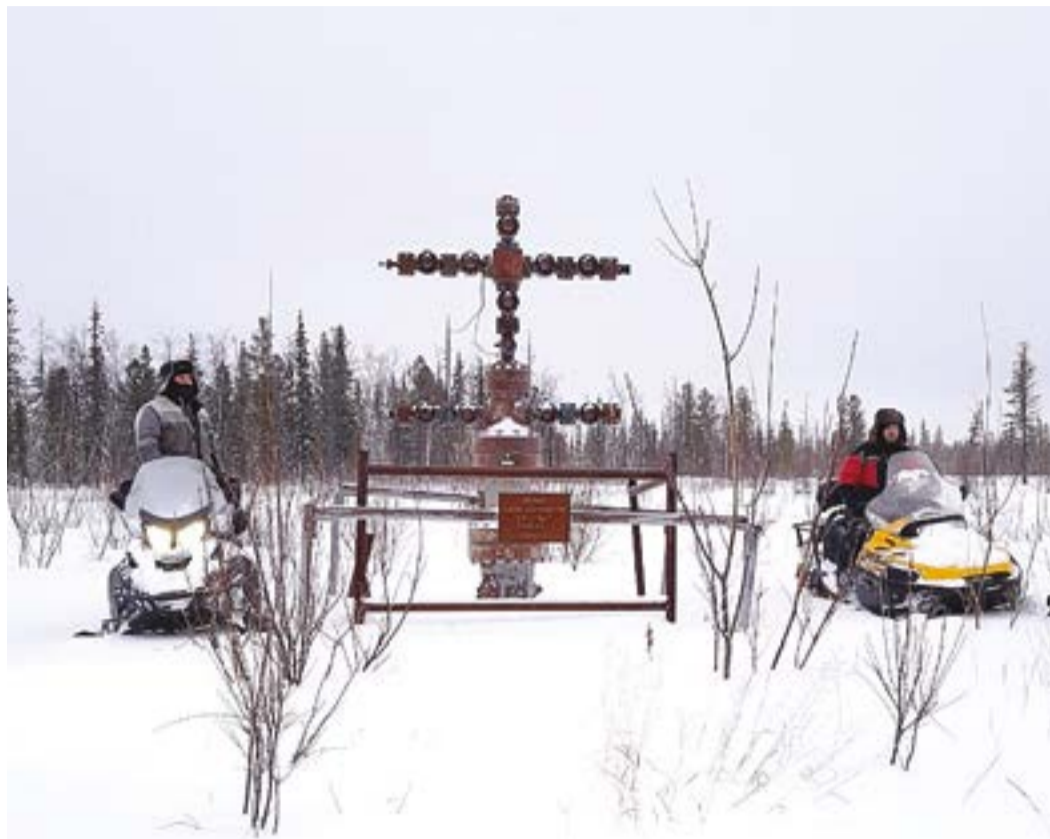
Первопроходцы предприятия достигли места будущего базирования людей и спецтехники на снегоходах

Общая протяженность маршрута от базы компании близ Нового Уренгоя до Ленского участка - почти 700 км по постоянным дорогам и по специально оборудованному «зимнику»