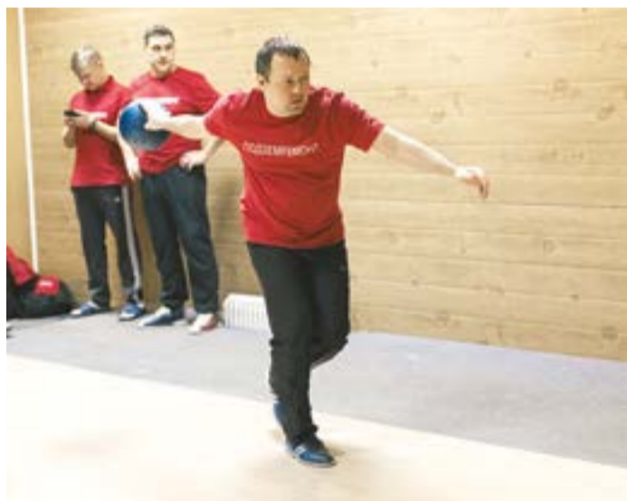
За соревнованием по боулингу интересно было наблюдать даже больше, чем участвовать