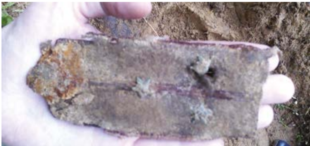
Одна из находок на месте гибели советского офицера

могла рассыпаться при вскрытии капсулы. Это уже была работа экспертов: с помощью методов спектрального анализа и других современных технологий им удавалось расшифровать текст. И тогда человек обретал имя! Затем мы находили родственников, которым торжественно передавали останки солдат для захоронения. Но таких случаев, увы, было немного. Если же не удавалось установить личность воина, его останки предавали земле на специальных мемориалах для безымянных солдат.