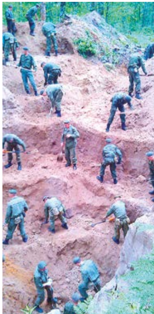
Бойцы поискового батальона раскапывают блиндаж в районе Барского озера в Ленинградской области