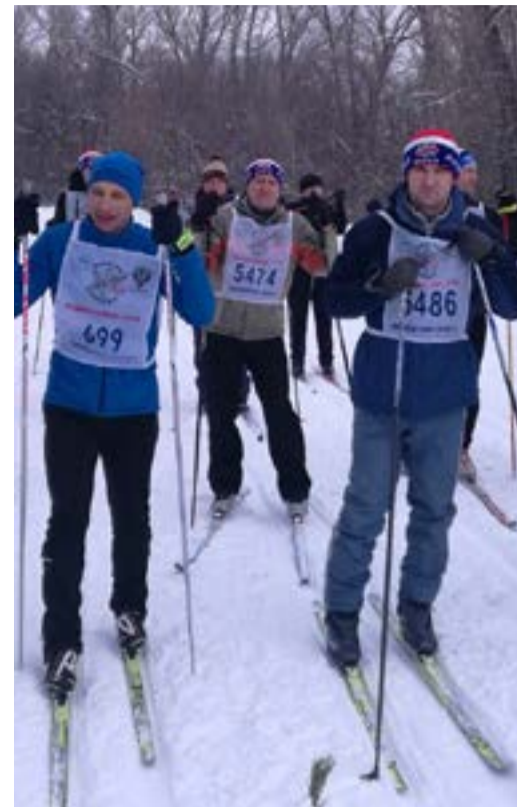
Работники Оренбургского филиала – участники «Лыжня России-2019».

Сотрудники компании «Газпром подземремонт Уренгой» всегда поддерживают организаторов спортивного праздника в их замечательном начинании – участие в массовом забеге «Лыжня России» является многолетней доброй традицией для работников Общества. Такие мероприятия очень важны, потому что они сплачивают и дают огромное количество позитивных эмоций.