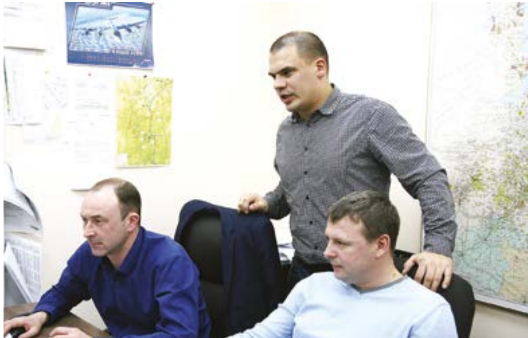
Геологи предприятия за работой

Командировки для геологов не редкость, поскольку некоторые вопросы нельзя решить на расстоянии, а иногда требуется только личное присутствие на ремонтируемых нефтегазовых объектах. Зачастую скважины находятся в районах, куда нельзя добраться традиционными способами. Так,