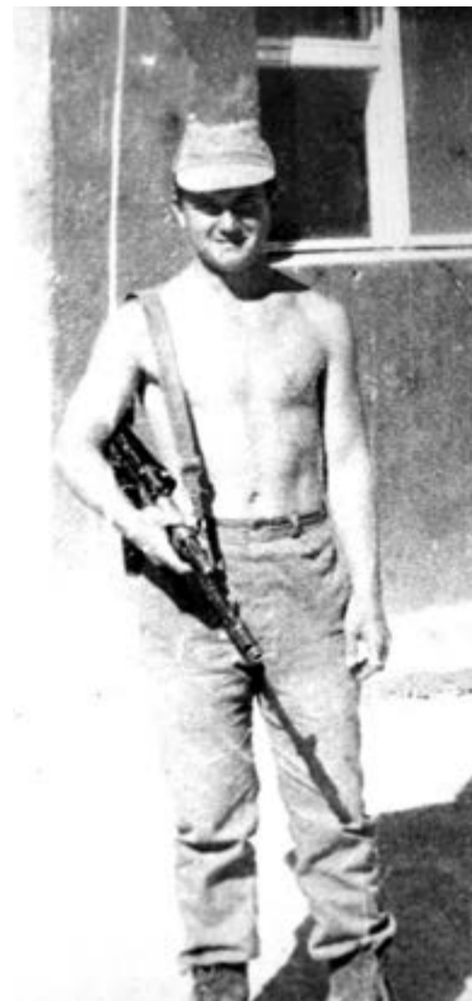
Во время службы в мотострелковой части

23 февраля – День защитника Отечества – был и остается праздником российских воинов – всех, кто сражался в бою, кто честно служил Родине. Это день настоящих мужчин. Именно о них мы рассказываем в сегодняшней подборке