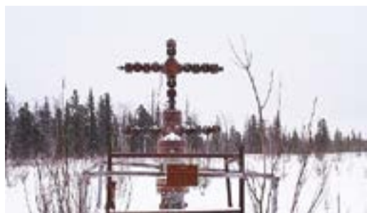
ПРОИЗВОДСТВЕННАЯ ПРОГРАММА Ликвидация скважин на Ленском лицензионном участке