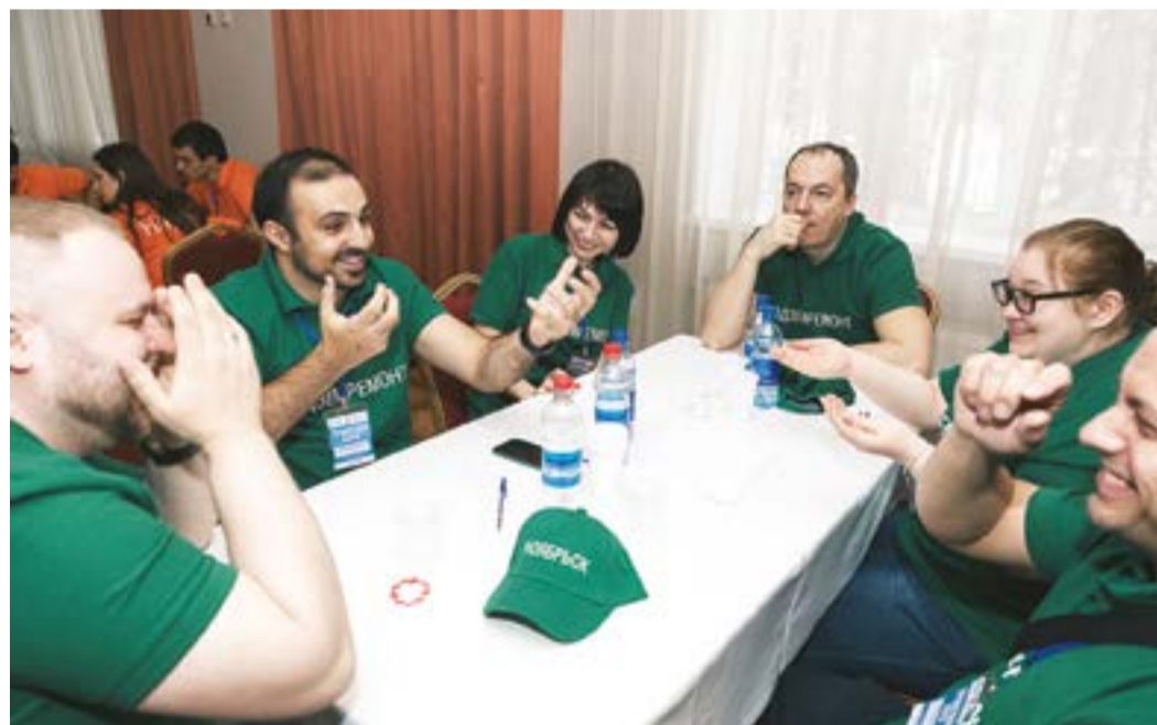
Игра «Узнать за 60 секунд» понравилась всем участникам

В соревнованиях на знания, смекалку и логику приняли участие восемь команд: сборные филиалов из Нового Уренгоя, Ноябрьска, Надыма, Ямбурга, Астрахани, Краснодара и Оренбурга, а также команда администрации предприятия. Коллективы боролись за каждый балл и в перерывах даже пытались опротестовать решения су-