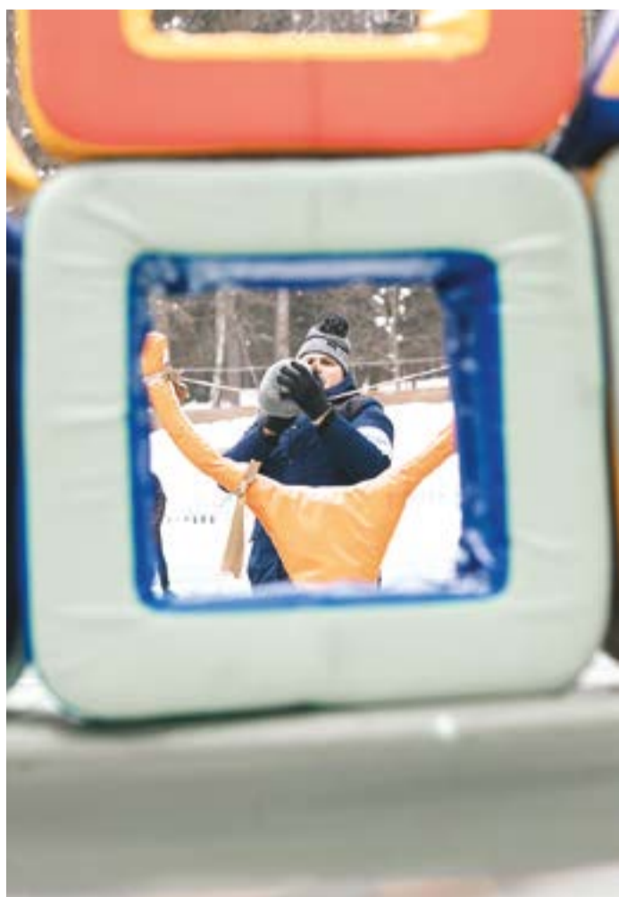
В ходе веселой эстафеты участники стреляли из рогатки по птичкам и возили медведей на ватрушке