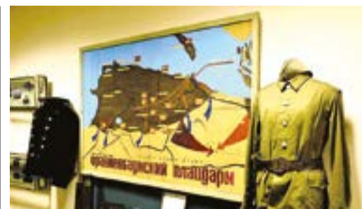
СТРАНИЦЫ ИСТОРИИ На благо школьного музея «Герои Ораниенбаумского плацдарма»