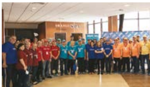
ИНТЕЛЛЕКТУАЛЬНЫЕ ТРАДИЦИИ В соревнованиях на знания, смекалку и логику победили уренгойцы