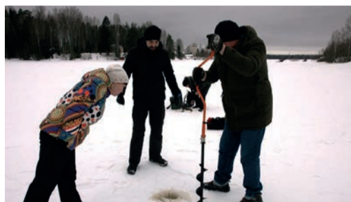
НАШИ ТРАДИЦИИ Зимняя рыбалка с детьми из Свирьстроля