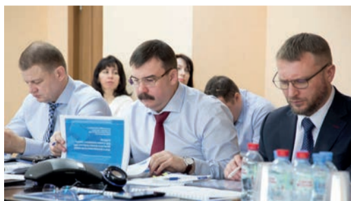
ПОДВЕДЕНЫ ИТОГИ ГОДА Состоялись балансовые комиссии филиалов