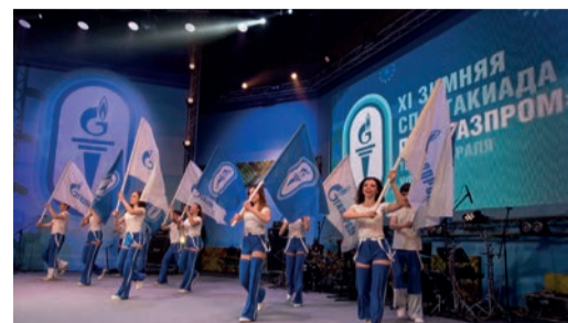
СПОРТ ГАЗПРОМА Завершилась зимняя спартакиада