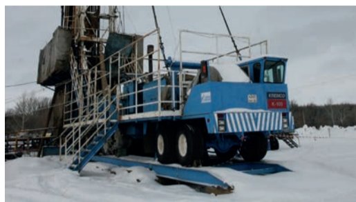
ПРОИЗВОДСТВЕННАЯ ПРОГРАММА Нефтяной сектор Оренбургского филиала