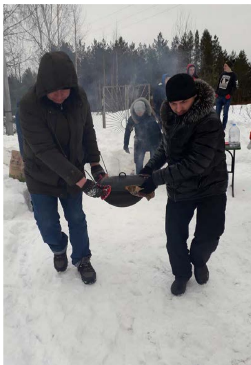
Самым интригующим моментом акции стала операция по перемещению плова – от костра в столовую детского дома

Еще одним подарком к праздникам от профсоюзной организации стало улучшение социально-бытовых условий работников. В кабинетах заменили старые светофильтры и офисные кресла, приобрели новое бытовое оборудование.