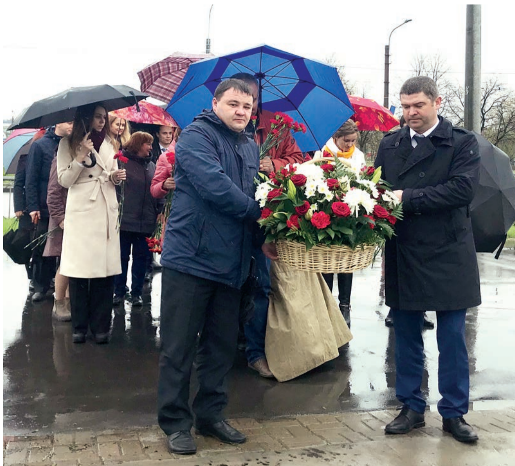
Сотрудники компании отдают дань памяти погибшим во время Великой Отечественной войны на мемориале «Журавли»

Несколько десятков сотрудников центрального офиса компании в Санкт-Петербурге приняли участие в торжественном памятном мероприятии.