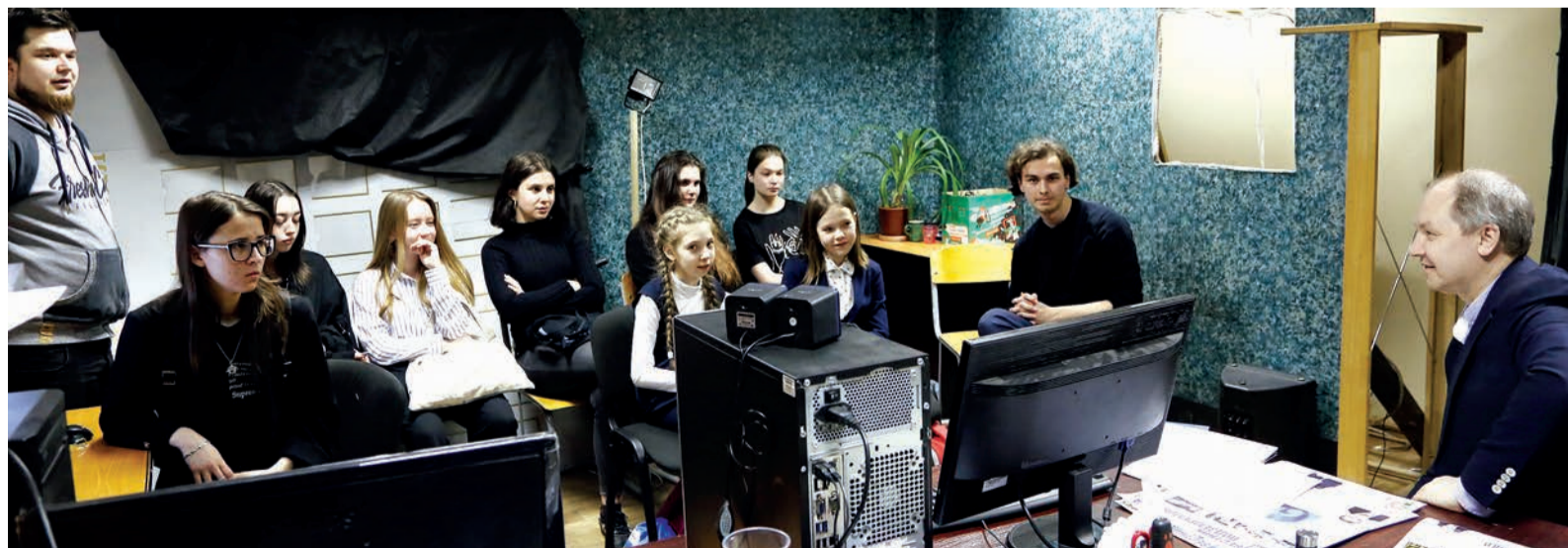
Встреча сотрудников службы по связям с общественностью и СМИ с учениками школы № 238

Сегодня в обществе «Газпром подземремонт Уренгой» работают первоклассные специалисты, мастера своего дела. Они могут не только решать трудные задачи на производстве, но и грамотно рассказать о своей профессии, заинтересовав ею будущее поколение. Служба по связям с общественностью и СМИ «Газпром подземремонт Уренгой» совместно с отделом кадров, трудовых отношений и социального развития начинает профориентационный проект «Путь в профессию».