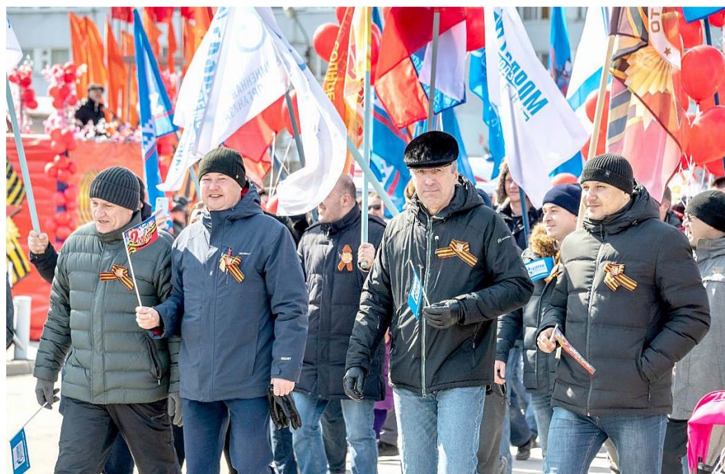
Участники парада в честь Дня Победы в Новом Уренгое