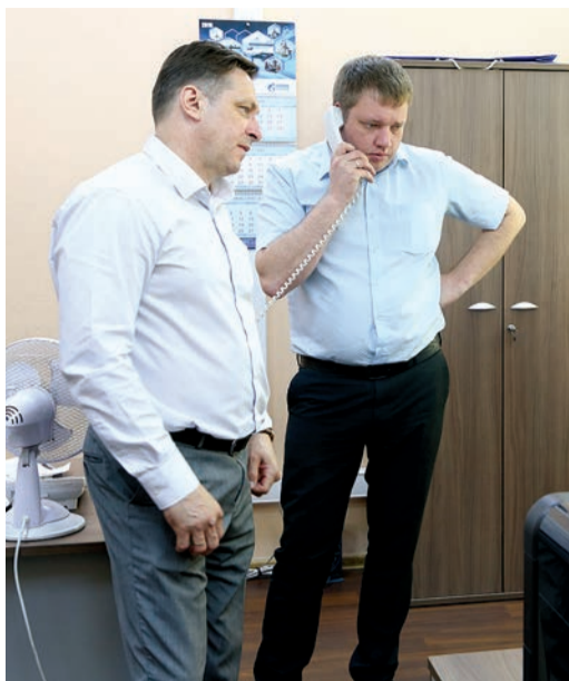
Важные вопросы нужно решать быстро

Главная задача ПДС – обеспечение производственного процесса во всех филиалах Общества. В производственно-диспетчерскую службу поступает оперативная информация из всех управлений по интенсификации и ремонту скважин. Собранный информация обрабатывается специалистами ПДС, которые распределяют запросы по соответствующим отделам и службам администрации ООО «Газпром подземремонт Уренгой». Информация заносится в протокол, назначаются ответственные по озвученным вопросам. По сути производственно-диспетчерская