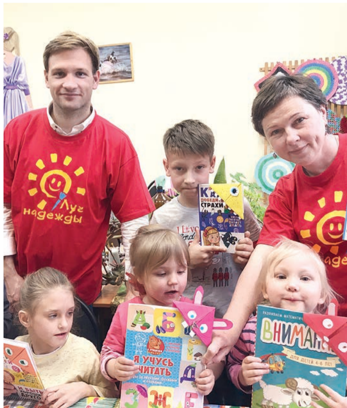
Каждый ребенок получил персональный подарок