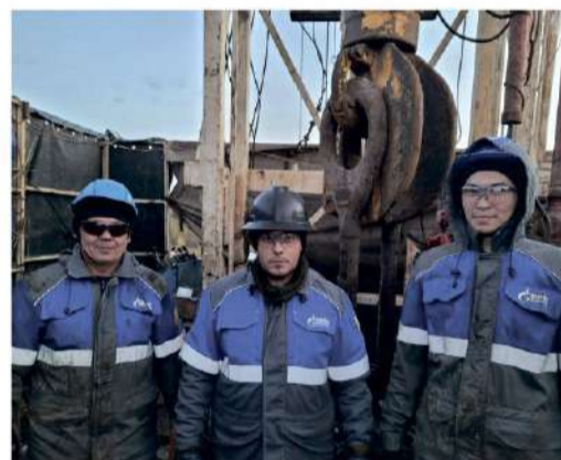
Коллектив - единая дружная команда

В процессе передислокации бригады было принято решение о том, что в первую очередь ремонтные работы начнутся на скважине № 6 Тевризского газоконденсатного месторождения. К работам специалисты Оренбургского УИРС приступили в начале августа. Бригада капитального ремонта выполняла работы по глушению скважины, монтажу оборудования, подъему лифтовых НКТ. Параллельно