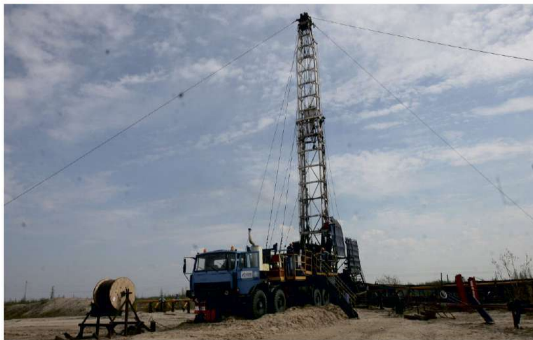
Производственную программу выполняют специалисты Уренгойского УИРС.

В производственном процессе в Надым-Пур-Газовском регионе задействованы подъемные и колтюбинговые установки. На