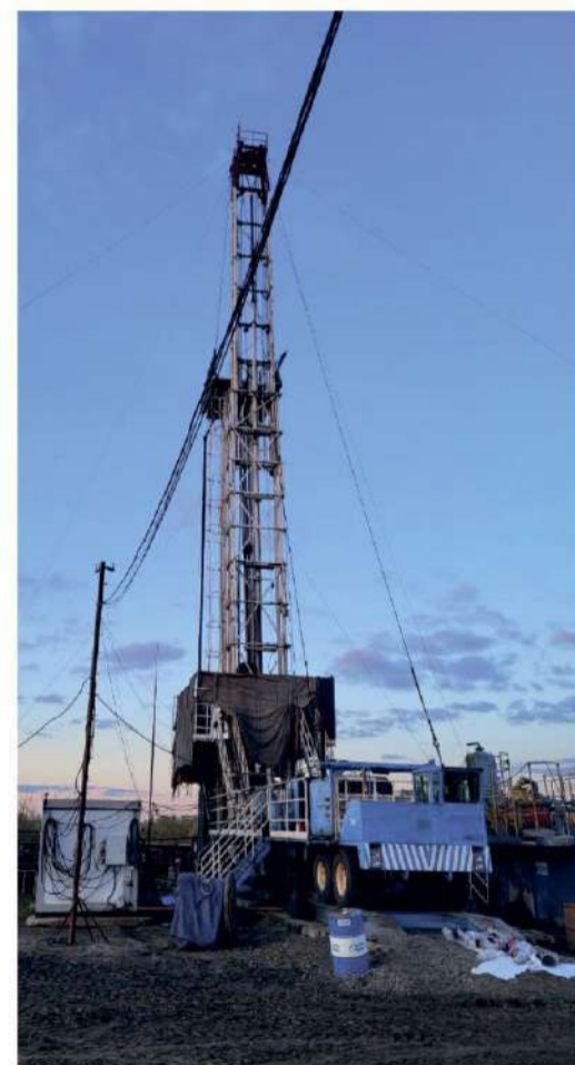
Тяжелый подъемный агрегат Кремко-100 на скважине № 5 Тевризского месторождения

Тевризский проект - непростой для ООО «Газпром подземремонт Уренгой». Для его реализации была выполнена специаль-