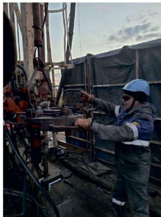
Идет технологический процесс

Прежде чем приступить к работам на месторождении работники Оренбургского УИРС, которому было поручено выполнить необходимые объемы работ, побывали на месторождении. Их путь оказался дальним и вёл через Магнитогорск, Челябинск, Курган, Ишим, Викулово, Усть-Ишим и Тевриз. В одну сторону проехали почти 1 700 километров, а обратно для разведки выбрали другую дорогу, где расстояние составило 2100 километров.