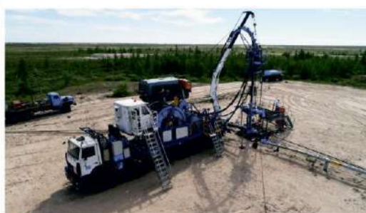
ПРОИЗВОДСТВЕННАЯ ПРОГРАММА Реализуя намеченные планы