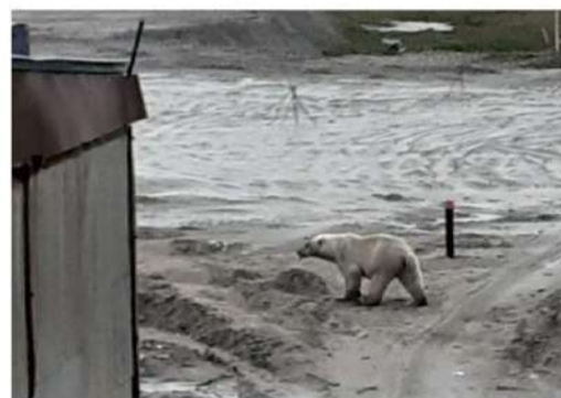
Белые медведи вблизи жилья – обыденность на территории Арктики