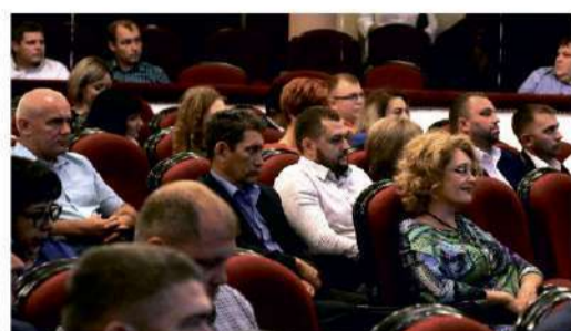
ПРОФЕССИОНАЛЬНЫЙ ПРАЗДНИК Оренбургское УИРС отмечает юбилей