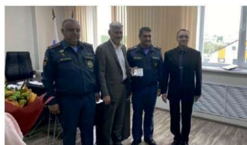
ЗАСЛУЖЕННАЯ НАГРАДА Медали от министерства