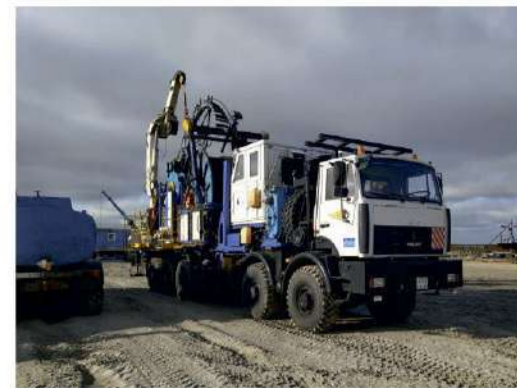
Колтюбинговая установка УКРС-30 выдвигается в полевой район

месторождение по зимнику будут направлены еще две бригады капитального ремонта и две бригады освоения скважин, два подъемных агрегата А-80 и колтюбинговая установка, оборудование для обустройства базы ВЗиС. Количество скважин, которые необходимо осваивать и сдавать заказчику, растет и мы будем наращивать наши силы на месторождении».