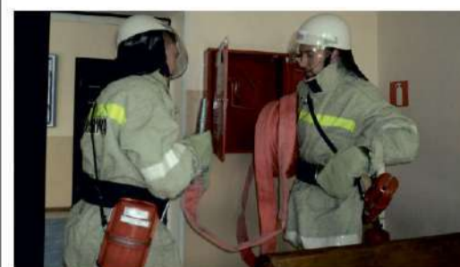
МИР БЕЗ ОПАСНОСТИ Учения в Астраханском филиале