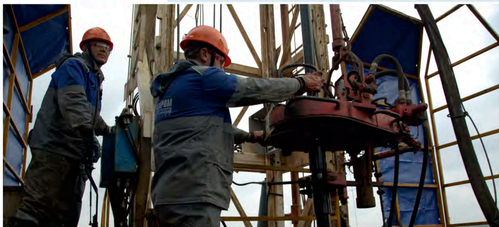
Интенсивность работ Краснодарского УИРС зимой 2021 года не снижается, несмотря на сложные погодные условия

Погода в последний месяц года постоянно преподносит сюрпризы. Ливни чередуются с заморозками и обледенениями дорог и технологических площадок. Почва периодически превращается в липкое месиво, а потом сковывается заморозками. В ноябре-декабре специалистам филиала приходится работать в крайне сложных условиях.