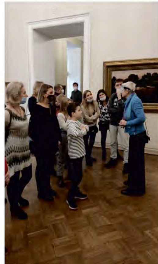
Работники администрации провели выходные в самых знаменитых музеях Санкт-Петербурга