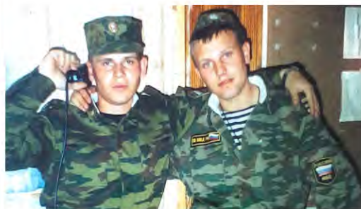
ДЕНЬ ЗАЩИТНИКА ОТЕЧЕСТВА Чествуем настоящих мужчин