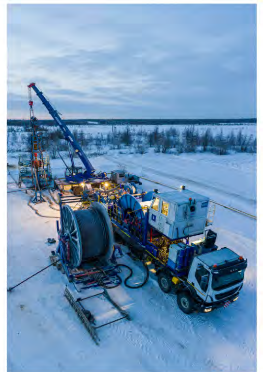
В условиях короткого дня и полярной ночи

В рамках производственного процесса среди главных приоритетов работников – соблюдение мер охраны труда и произ-