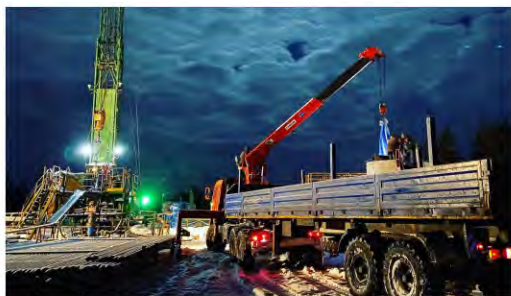
КАПИТАЛЬНЫЙ РЕМОНТ Дела и заботы Ноябрьского филиала