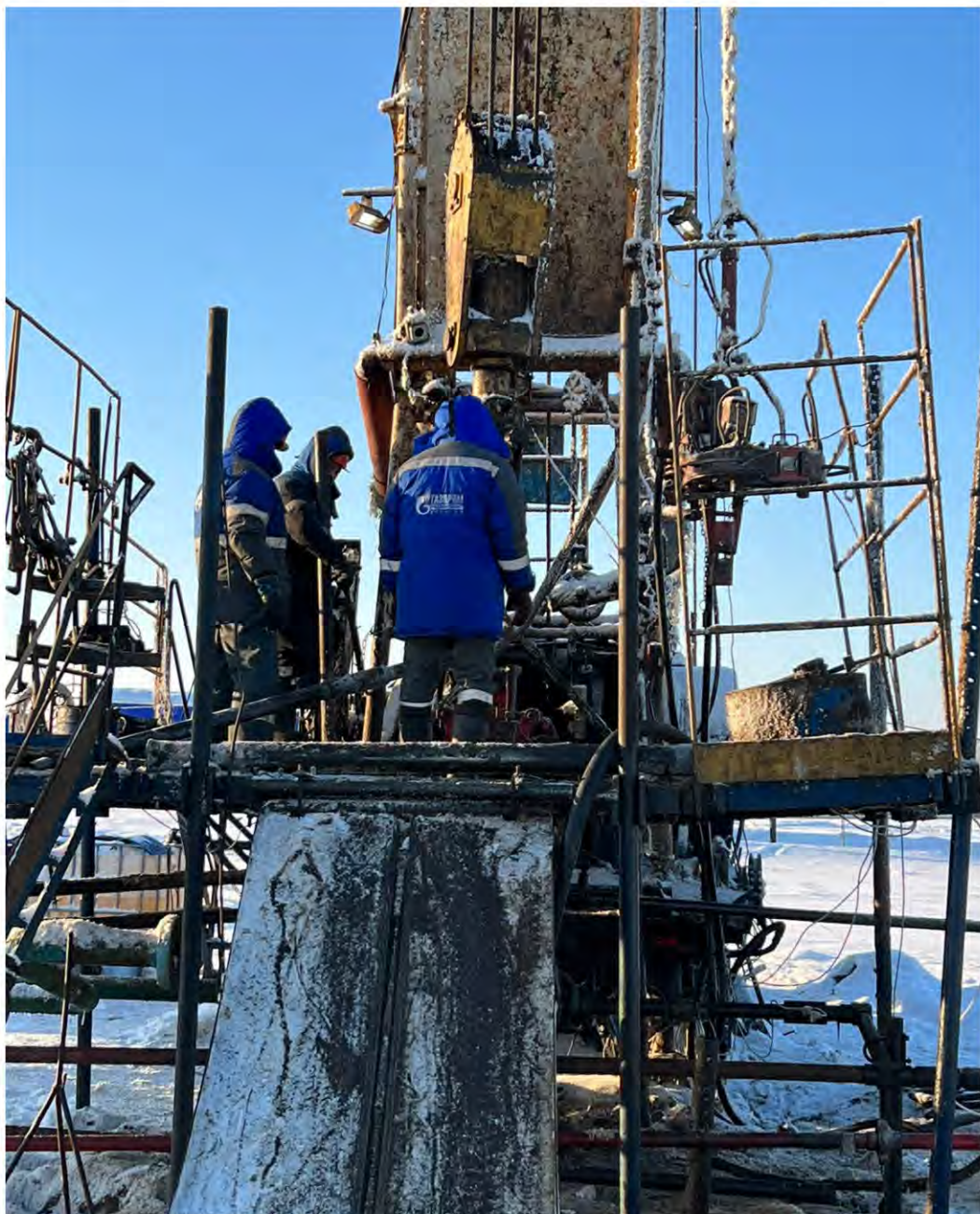
Специалисты Ноябрьского филиала ведут ремонт газовой скважины

За 2021 год Ноябрьским УИРС выполнено 60 операций, в том числе: 28 капитальных ремонтов скважин ООО «Газпром добыча Ноябрьск» (24 ремонта – ЯНАО, 4 ремонта – Камчатка); 10 капитальных ремонтов скважин ЗАО «ПУРГАЗ»; 3 ликвидации скважин ООО «Газпром добыча Ноябрьск»; 4 операции по спуску КПО и освоению скважин по договору с АО «Газстройпром»; а также операции по доставке геофизических приборов, по исследованию, ликвидации, расконсервации скважин; операция по расконсервации, испытанию, консервации разведочной скважины Бухаровского месторождения ООО «Газпром добыча Ноябрьск»; операция по реконструкции скважин Щелковского ПХГ.