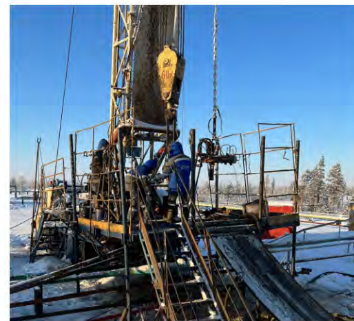
Производственная программа будет выполнена в любой ситуации

В отчетном периоде запланировано и выполнено 13 мероприятий по улучшению условий и охране труда: обеспечение электрогазосварщиков искрозащитными СИЗ при работе на высоте; приобретение диетических (лечебно-профилактических) напитков для обеспечения работников, занятых во вредных условиях труда; проведение замеров в рамках производственного контроля за соблюдением санитарных правил и норм; приобретение нормативно-технической литературы для повышения компетентности работников. Благодаря этим мероприятиям улучшены условия труда шести работников.