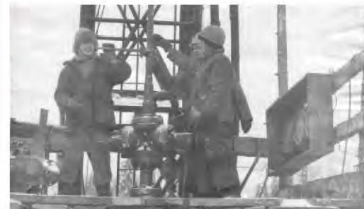
НАВСТРЕЧУ ЮБИЛЕЮ Конкурс архивных фотографий