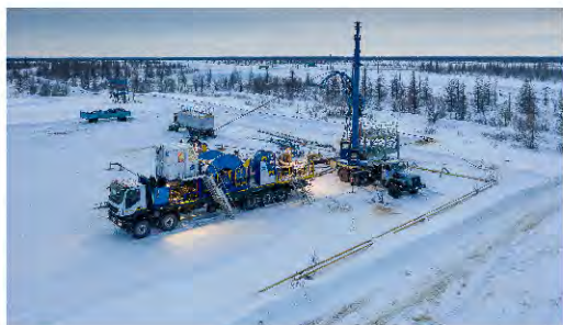
ПРОИЗВОДСТВЕННЫЙ ДНЕВНИК Новый год — новые задачи