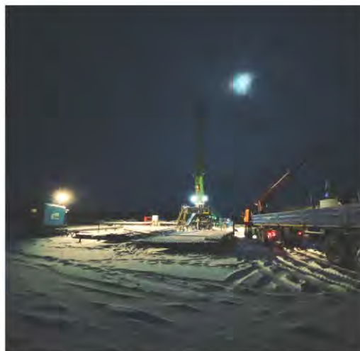
Полярная ночь и северное сияние – спутники работников филиала в северных регионах

Увеличение количества рабочих мест с вредными условиями труда (класс 3.1; 3.2) связано с вновь введенными рабочими местами, а не с ухудшением условий труда и переходом рабочих мест в более вредный класс.