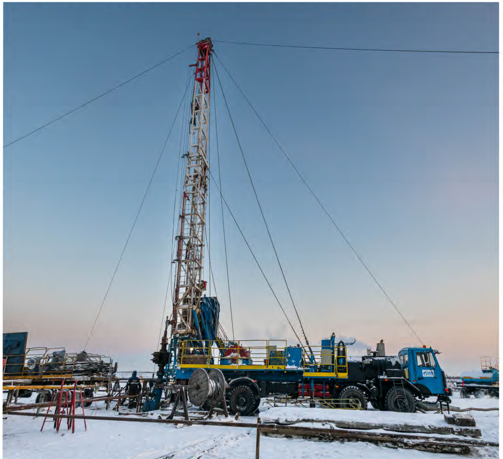
На передовых рубежах выполнения производственной программы