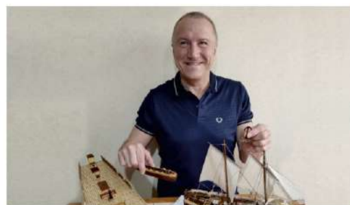
МИР УВЛЕЧЕНИЙ Коллекция – это жизнь