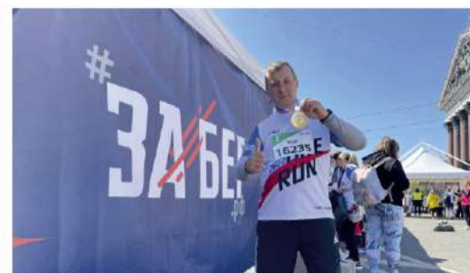
СПОРТИВНЫЙ КАЛЕЙДОСКОП Бег, ходьба, здоровье!