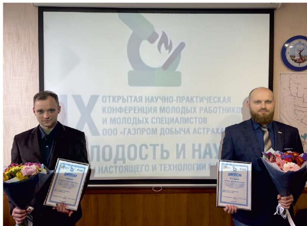
Победители отмечены дипломами