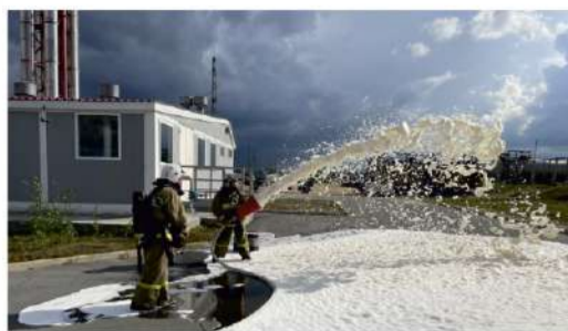
БЕЗ ОПАСНОСТИ Учения в Уренгойском УИРС