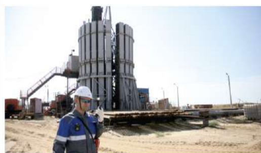
РАБОТА И ЖИЗНЬ Астраханский филиал