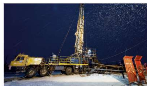
БЕЗ ОПАСНОСТЕЙ Взгляд из региона – Надымский филиал