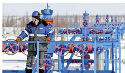
РОССИЯ И ЕВРОПА ПАО «Газпром» и поставки газа