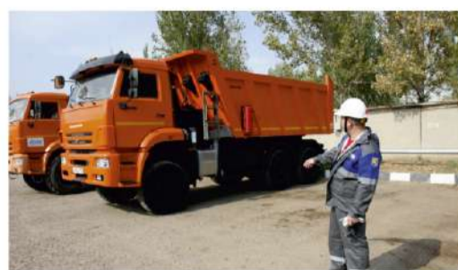
МАСТЕРА ВЫСОКОГО КЛАССА Конкурс профессионалов