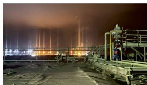
ПРОИЗВОДСТВЕННАЯ ПРОГРАММА Дела и заботы филиалов компании