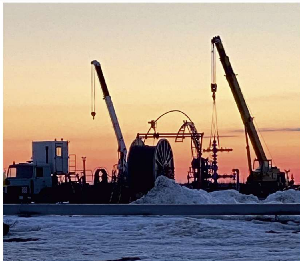
Люди и техника на передовой производственного фронта

На Ковыктинском газоконденсатном месторождении, действует несколько бригад Ноябрьского филиала, работа ведется на значительном количестве скважин. Именно Ковыктинское ГКМ сегодня – одно из самых важнейших месторождений в производственной программе ООО «Газпром