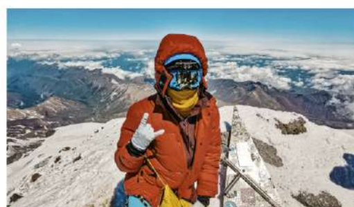
НАШИ УВЛЕЧЕНИЯ Путешествия – это жизнь