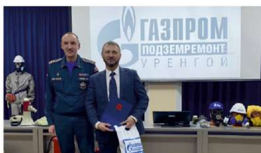
НАГРАДЫ - ДОСТОЙНЫМ За заслуги в важном деле