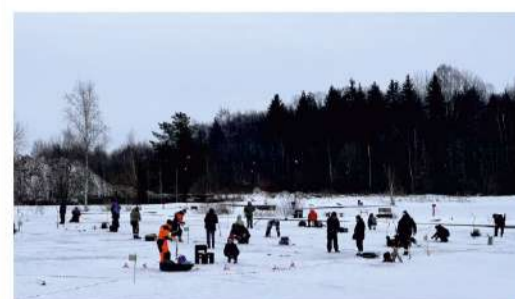
ДОБРЫЕ ТРАДИЦИИ На рыбалку - всей компанией