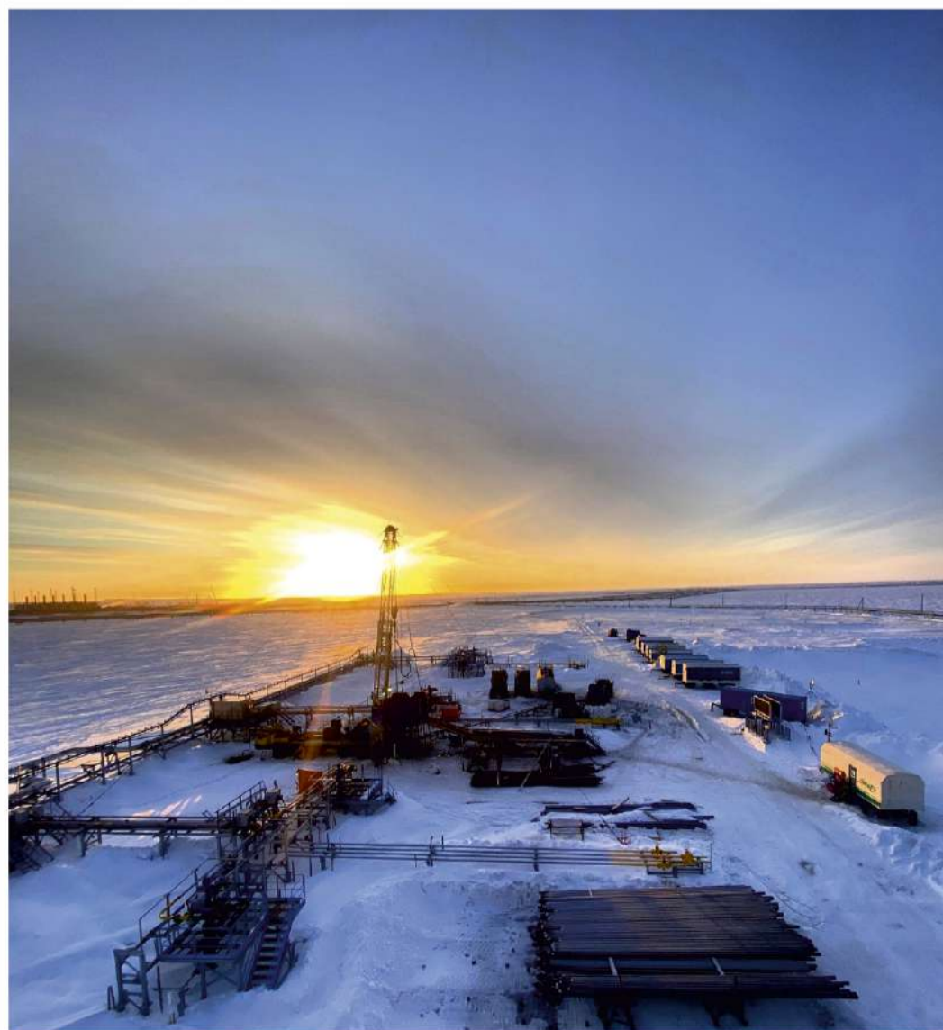
Подразделения компании в 2023 году работают над новыми производственными задачами