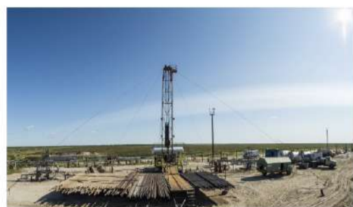
ПРОИЗВОДСТВЕННАЯ ПРОГРАММА Дела и заботы филиалов