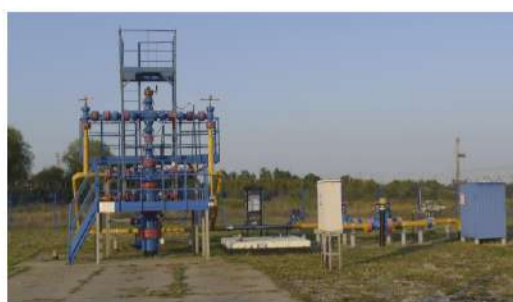
НА КАЛИНИНГРАДСКОМ ПХГ Оренбургский УИРС – на дальних рубежах