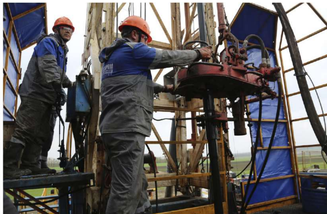
Лето – горячая производственная пора