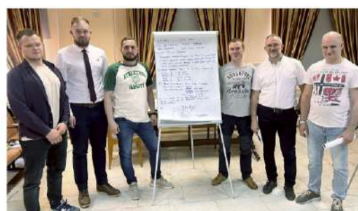
ОБУЧЕНИЕ - ОСНОВА БЕЗОПАСНОСТИ Обучение поможет с профилактикой происшествий