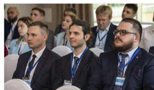
К НОВЫМ ЗНАНИЯМ Итоги конференции молодых специалистов