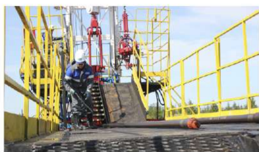
МАСТЕР-КЛАСС Конкурс среди лучших