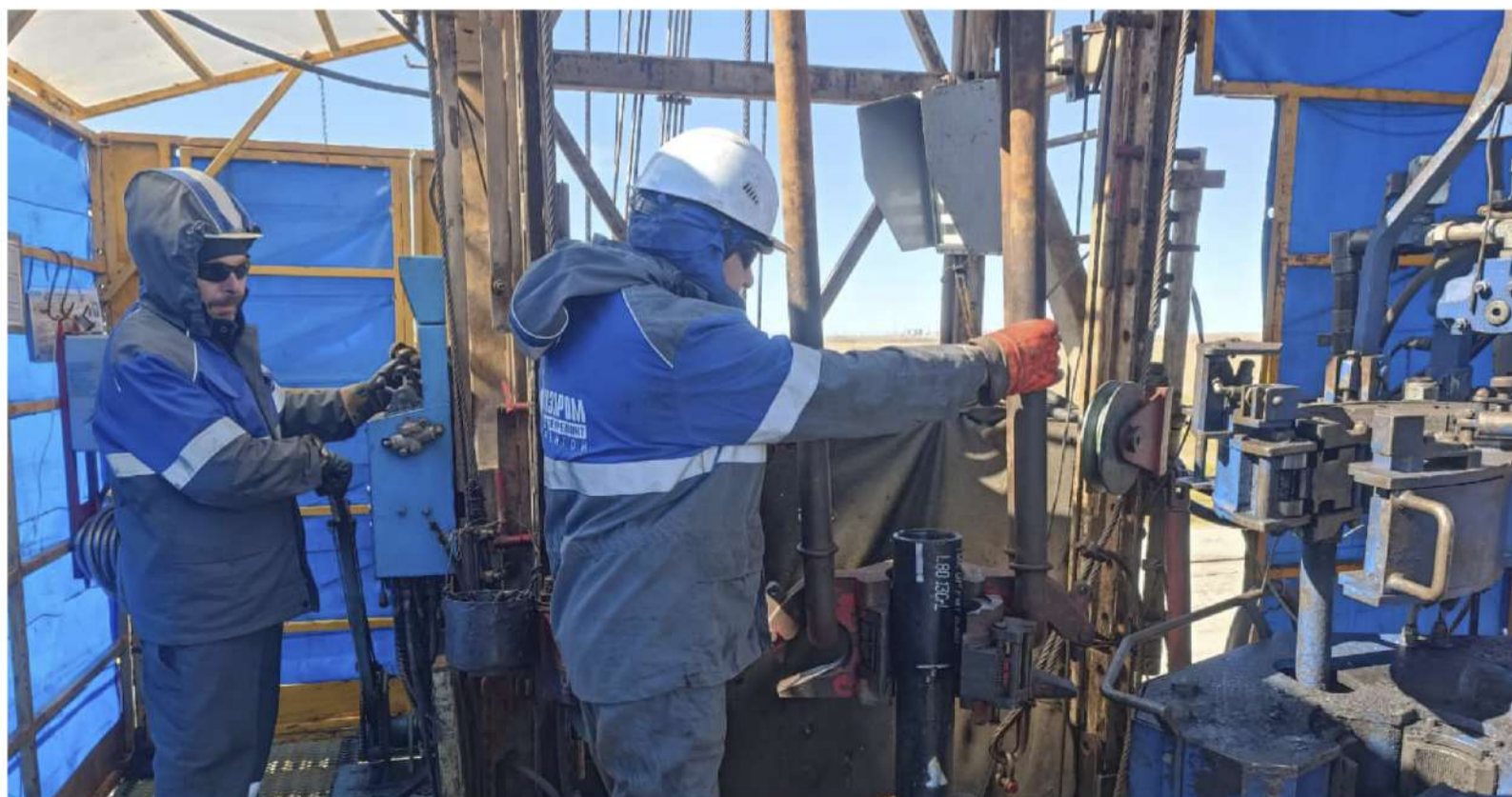
Бригады капитального ремонта скважин Надымского филиала первыми оснащены комплексами видеонаблюдения

Виктор Зубков и Алексей Миллер переизбраны Председателем и заместителем Председателя Совета директоров ПАО «Газпром».