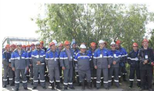
МНЕНИЕ КОЛЛЕКТИВА Итоги опроса – краткий конспект