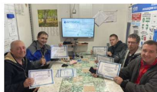
УЧИТЬСЯ НИКОГДА НЕ ПОЗДНО На пользу каждому